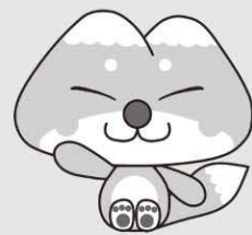
天栄村マスコットキャラクター ふたまたぎつね