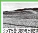
うっすら雪化粧の竜ヶ崎古墳

12月29日の東京への帰省の際、雪がかなり降っていたので雪が積もる前に着くように朝早く出発しました。天栄村に戻る頃には雪が積もっているだろうと心配していましたが、年が明けて1月3日に帰ってきてみると雪はそれほど残っていなかったのでホッとしました。