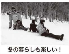
冬の暮らしも楽しい！