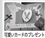
可愛いカードのプレゼント