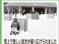
雪上で激しい戦いが繰り広げられました

この経験で、東北の寒さに対する耐久力がかなりアップしました。都会では体験できない貴重な体験でした。選手の皆様、関係者の皆様、大変お疲れ様でした！