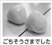
ごちそうさまでした

自ら手をかけて作ったものを食べることは、天栄村では珍しくないことですが、実はとても貴重な事です。「家庭菜園をやりたい」という都会からの移住検討者が多いのもこうした理由からかもしれません。地産地消ならぬ“自産自消”が天栄暮らしのPRポイントになりそうです。