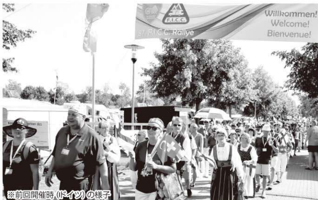
※前回開催時(ドイツ)の様子

なお、この世界大会期間中は、てんえい商工祭の同時開催や清酒で乾杯イベントとのコラボなど地域交流イベントが多数企画されております。