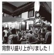
宵祭り盛り上がりました！

この2日間は湯本集落の馬頭観音祭が開催されており、関係人口の皆さんは“カズギーズ”として地域の方に混ざって宵祭りの御神輿を担ぎました。わっしょいの掛け声で汗だくになりながら担ぎ、その後の懇親会では地域の方と語り合った事で距離が一気に縮まったと感じた方も多かったようです。またお祭りでは、5月の関係人口ミーティングで出された「浴道をもっと明るくしては」というアイデアを採用し、御神輿の通り道に提灯を飾り付け、お祭りの雰囲気盛り上げていました。