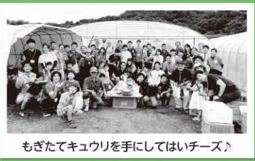
もぎたてキュウリを手にしてはいチーズ♪

次回は秋の天栄米の収穫体験です。また皆様と再会することが今からとても楽しみです。