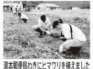
湯本郵便局わきにヒマワリを植えました

今回の感想と反省を踏まえて、今後も関係人口、大学生との交流が地域活性に繋がるようなあり方を考えていきたいです。