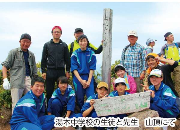
湯本中学校の生徒と先生 山頂にて