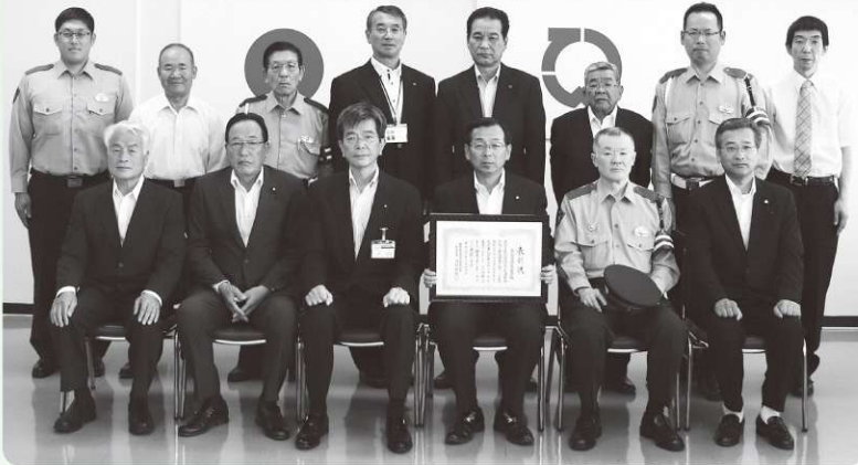
天栄村交通事故死者ゼロ1000日達成 福島県交通対策協議会長表彰伝達式