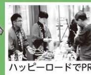
ハッピーロードでPR

11月17日には東京都板橋区のハッピーロード大山商店街で行われた天栄村ふるさとイベントが開催されました。天栄米や天栄ヤーコン、天栄村産採れたて野菜、和菓子などの販売、イートインスペースでは「マカで元気な村づくり」をスローガンに栽培が始まっている、ベジマカを使用した天栄マカカレーを提供し、多くの人に天栄村のPRが出来ました。