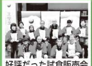
好評だった試食販売会

誠にありがとうございます。生産者さんのお米の種まきや、収穫のお手伝い、定期的に例会を開いて、研鑽を重ねているお姿を拝見しているので、今回の金賞受賞をととても嬉しく思い感動しました。12月7日には道の駅季の里天栄で、生産者さんの方々による試食販売会が行われ、大変好評で、多くの人に購入して頂きました。私も国際大会10回の金賞受賞をしている天栄米のPRを頑張りたいと思います！