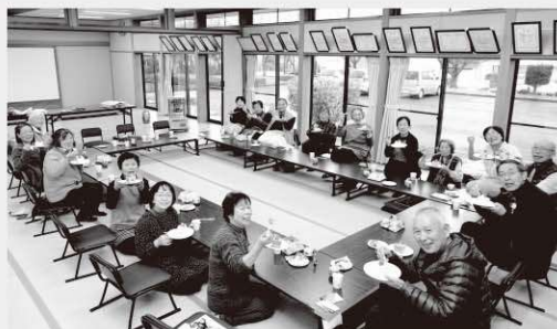
大山地区クリスマス会の様子