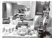
天栄米、好評でした

昨年1年間も、移住関係のみならずPR方面でも多くの方との出会いがありました。今後も、繋がりを大切に天栄村ファンを増やしていきたいです。本年もどうぞよろしくお願い致します。