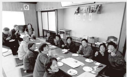
高林地区クリスマス会の様子