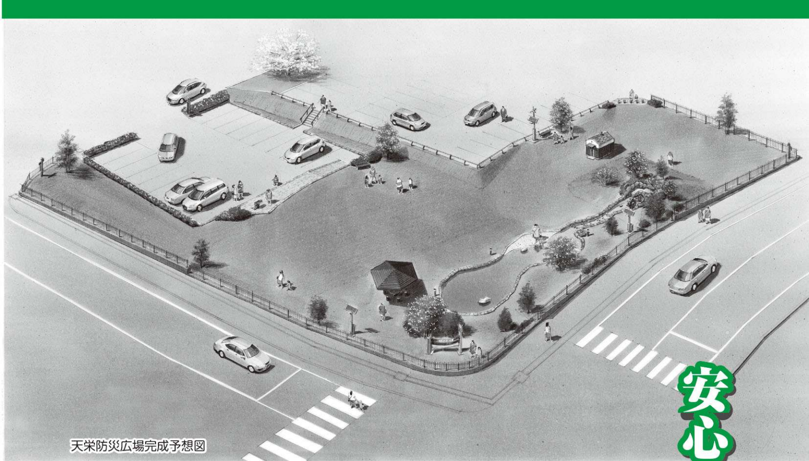
天栄防災広場完成予想図

防災行政無線の屋外子局でデジタル化が未移行となっている屋外子局16局の更新を実施し、難聴地域の解消を図ります。