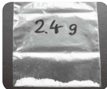
当面減らしたい食塩の量

そうは言うけれど、実際どうしたらいいの?? 来月は、誰にでも、無理なく、すぐにできる減塩の工夫をお伝えします。