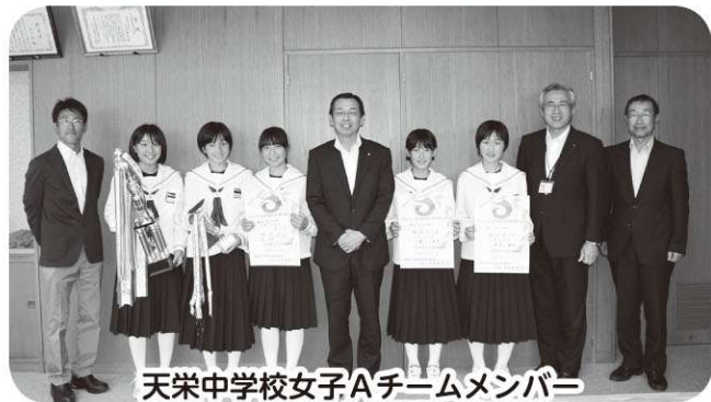
天栄中学校女子Aチームメンバー