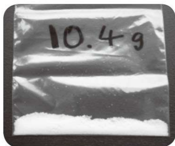
現在の食塩摂取量