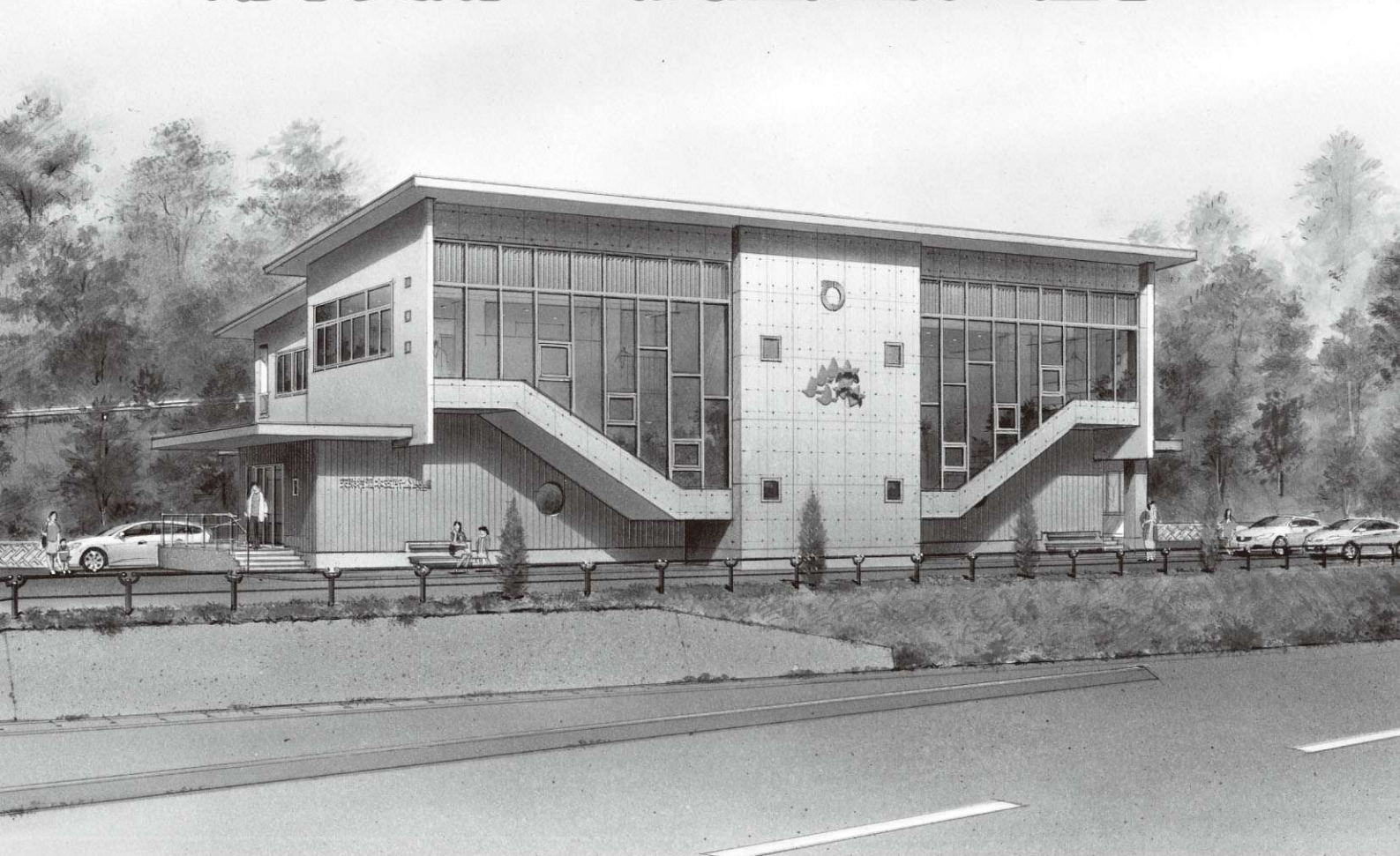
湯本地区防災センター完成予想図