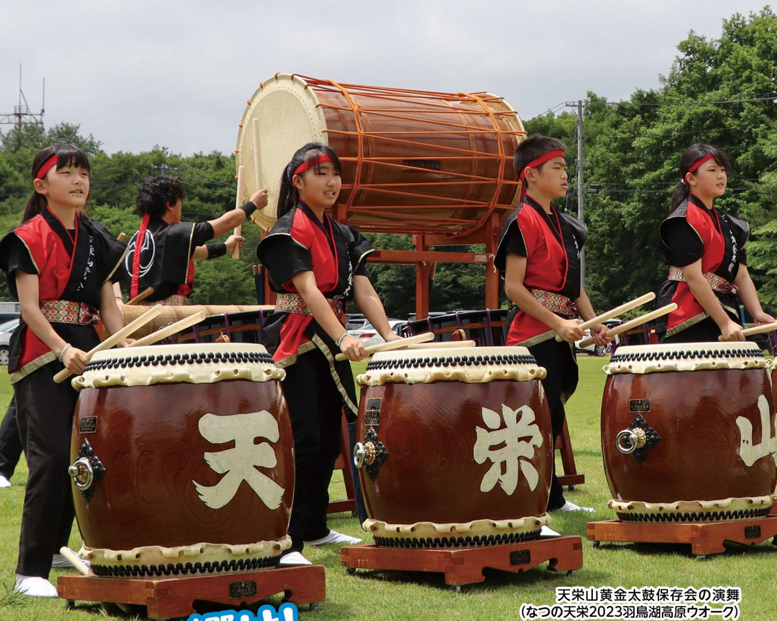
天栄山黄金太鼓保存会の演舞 (なつの天栄2023羽鳥湖高原ウオーク)