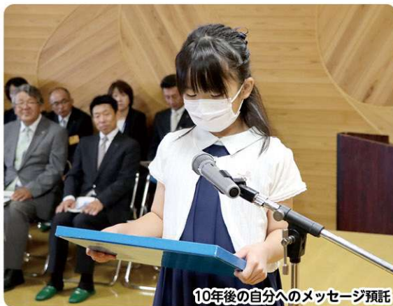
10年後の自分へのメッセージ預託