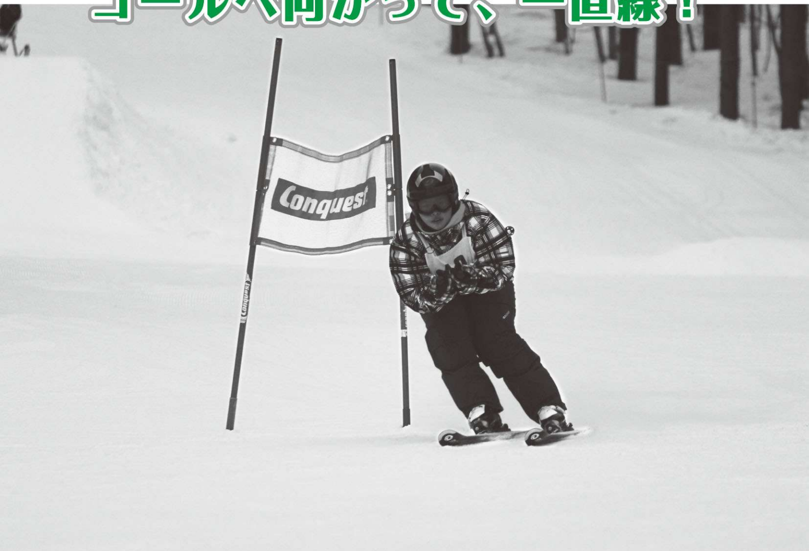
湯本地区区学校スキー大会