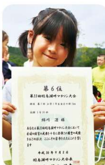
第7部 小学1年生女子の部