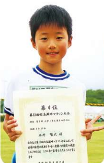
第3部 小学3年生男子の部