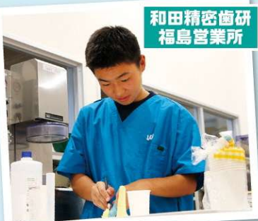
和田精密歯研 福島営業所