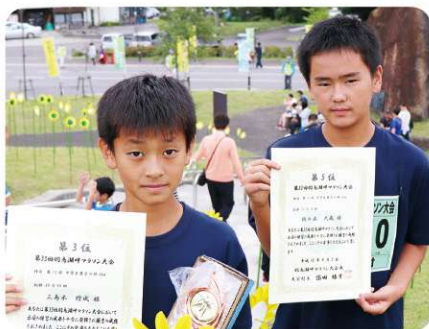
第13部 中学生男子の部 第13部 中学生男子の部