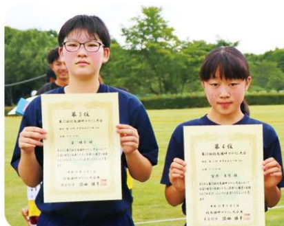
第14部 中学生女子の部 第14部 中学生女子の部