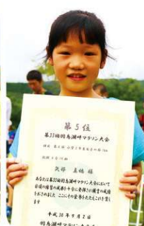
第8部 小学2年生女子の部