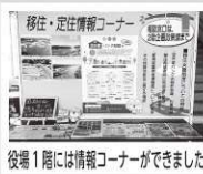
役場1階には情報コーナーができました

説明をしている中で、まだ自身の勉強が足りない部分や、相手が必要な情報が欲しいのかが分かってきましたので、もっと説明の内容を充実させて、天栄村で暮らす魅力を伝えていきたいです。