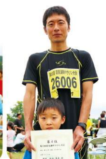
第26部 父親・子の部