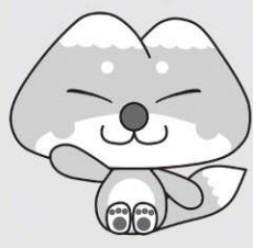
天栄村マスコットキャラクター ふたまたぎつね