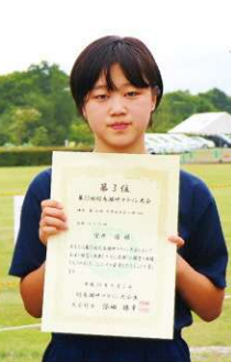
第14部 中学生女子の部