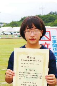
第14部 中学生女子の部