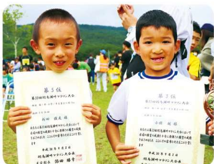
第1部 小学1年生男子の部 第1部 小学1年生男子の部