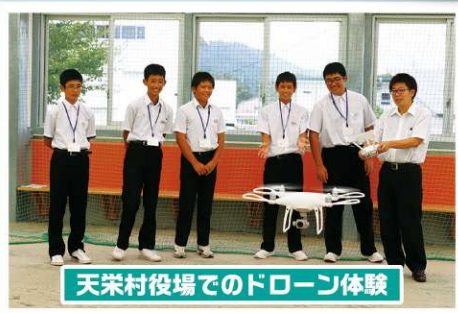
天栄村役場でのドローン体験