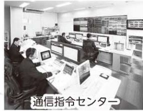
通信指令センター

須賀川市、岩瀬郡、石川郡からの119番通報（年間約7,000件）は、全て須賀川市丸田町にある消防指令センターで受信しています。