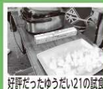
好評だったゆうだい21の試食

12月1日と2日に道の駅季の里天栄で天栄村3大ブランド農産物フェアが行われ、2日は私も手伝いで参加しました。フェアでは第20回米・食味コンクール国際大会において特別優秀賞を受賞した天栄米「ゆうだい21」の販売も行われ、多くの方に試食をしていただいたところ、大変好評でした。私も自宅で食べてみましたが、甘みと旨味があり、もちもちした食感でとても美味しく、何杯でもいけてしまう味でした。このお米が自宅で炊きあがっていると考えると、家に帰るのが楽しみになってしまう程の美味しさです。