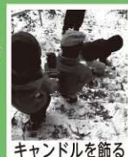
キャンドルを飾る

天栄村は3大ブランドをはじめとした美味しい農産物の宝庫であったり、それぞれの地域ごとにあふれる魅力がたくさんありますので、今年もどんどん情報発信をしていきたいと思っています。本年もどうぞよろしくお願い致します。