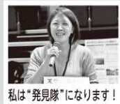
私は「発見隊」になります!

4月に移住コーディネーターとなつてから、移住を考える多くの方と関わらせていただきました。今年も移住、そして天栄村と繋がりたいという関係人口について、もっとお役に立てるよう頑張ります。本年もどうぞよろしくお願い致します。