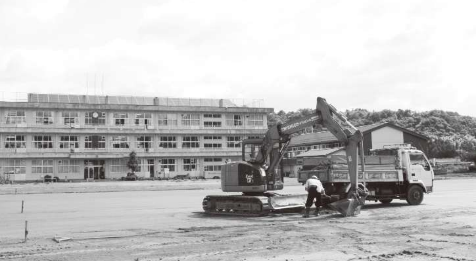
大里小学校表土除去の様子