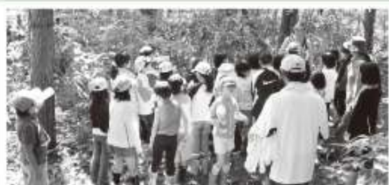
「みんなで森の中でコブナラを見学」