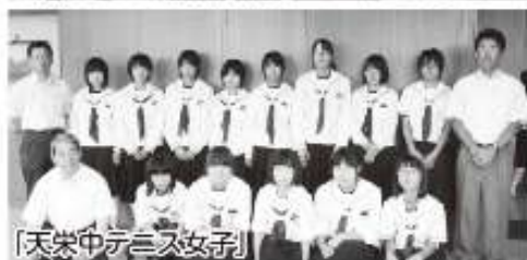
〔天栄中テニス女子〕