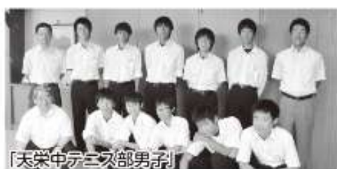
〔天栄中テニス部男子〕