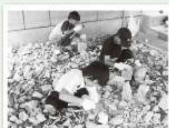
「ゴーグルをかけ化石の発掘を楽しみました」

夜は、東北大学湯本分室の方を講師に招き、湯本ほたるの里でホテル視察をし、また宿泊は二岐温泉でおいしい夕食と温泉で疲れを癒しとても充実した1日を過ごしました。