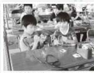
「専用の機械を使ってのガラス絵付けは初体験でした」

8月8日～9日に実施したプランDは、小学生27人、引率2人の計29名が参加し、猪苗代町方面で野口英世記念館の見学及び世界のガラス館での絵付け教室を体験、午後にはいなわしろ淡水魚館で世界の淡水魚を見学しました。