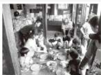
「せいべい焼きの実演を熱心に見る子どもたち」

8月2日～3日に実施したプランBは、小学生20人、中学生1人、引率1人の計22名の参加となり、初日は喜多方市の山中煎餅本舗でたまりせんべいの手焼きとカイギュランドたかさとで見学及び化石発掘を体験しました。