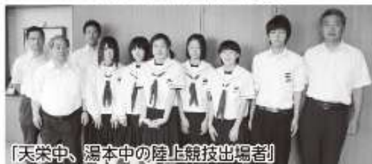
〔天栄中、湯本中の陸上競技出場者〕