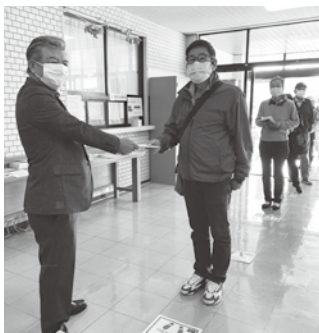
天栄村プレミアム商品券販売の様子