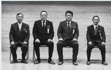
特別功労表彰の揚妻議員(一番左)ら