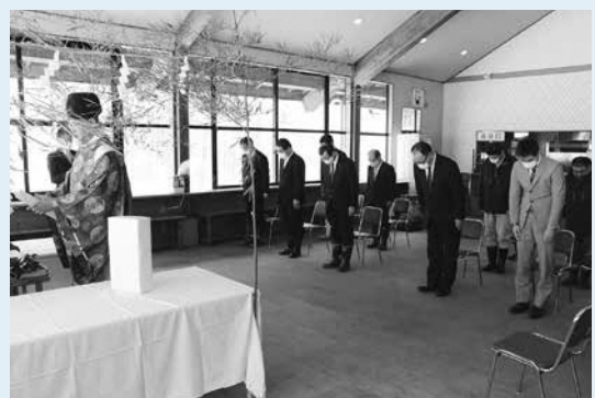
スキーリゾート天栄安全祈願祭

12月26日からの営業スタートを前に、積雪30cmになったグレンデは、多くのスキーヤーを迎える準備が進められていました。