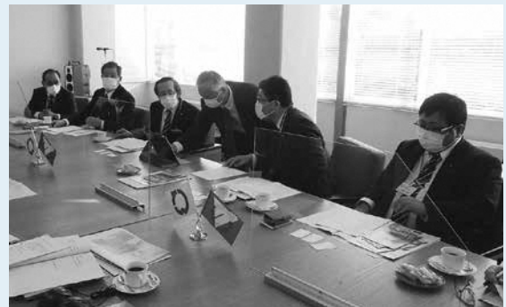
秋田県大湯村議会での行政調査

今後、本村議会において予算・決算の特別委員会やペーパーレス化の導入を検討する上で、様々な運営方法があることを知り、大変参考になる行政調査を行うことができました。