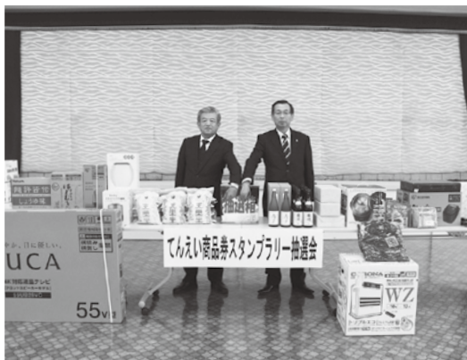
スタンプラリー抽選会の様子

11月末時点で村外宿泊者が2,297名、村民日帰り泊者が70名、村民日帰り泊者が130名の利用です。今後については観光協会と十分に話し合いを進めて参りたいと思います。