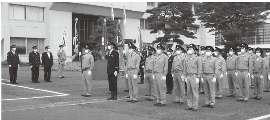
天栄村消防団秋季検閲式の様子

規定する当該年度の「消防費に係る基準財政需要額」により按分した割合とされており、この「消防費に係る基準財政需要額」は、国の示す算定基準に基づき計算しますが、毎年同額とはならないため、分担金の額も毎年変更となるものであります。なお、直近4年分の本村の分担金については、次の表のとおりです。