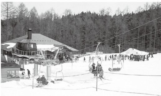
スキーリゾート天栄

指定管理委託を行っている農業・観光関係施設の数は、5施設であり、本年の指定管理料は、合計で1,490万円です。