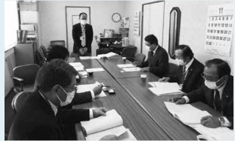
矢祭町議会での行政調査

特別委員会での質疑は事前通告制で、質問は原則3回までと定めている旨の説明を受けました。議論の焦点を明確にしている点が参考になりました。