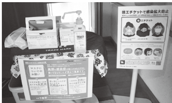
特別養護老人天栄ホームでの感染症対策の様子

村内の保育所、幼稚園、小、中学校や特別養護老人ホームにおいて、新型コロナウイルス感染症のクラスターが起きた時にはどのような対応策を考えているのか。また、重症者が出た時はどのような対応をするのか、村民の皆様に分かりやすく説明願いたい。