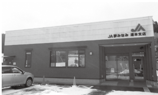
JA夢みなみ 湯本支店

来年3月1日より湯本支店の業務はATMを残し、すべて天栄支店に業務集約されるとの住民説明会が11月に行われました。唐突な支店閉鎖の表明に住民は困惑しています。湯本支店は住民や企業にとって重要な金融機関であり村指定金融機関でもあります。このこ