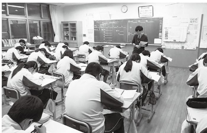
3年生を対象に塾講師を活用した学習支援事業（天栄中学校）

につきましても、一般財源の確保が厳しいと見込まれるため、行政サービスの質を低下させることのないよう事務事業の見直しを図りながら、新型コロナウイルス感染症に対応する取り組みを推進して参ります。