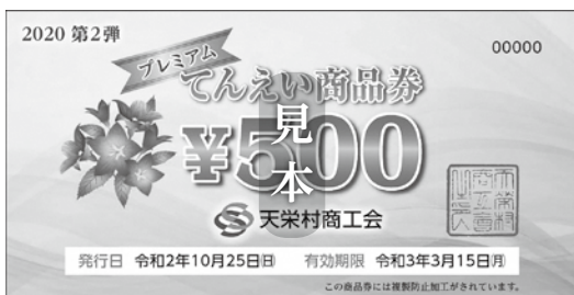
天栄村プレミアム商品券