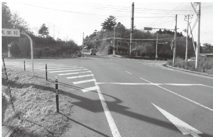
県道下松本・鏡石停車場線と県道郡山矢吹線の交差点