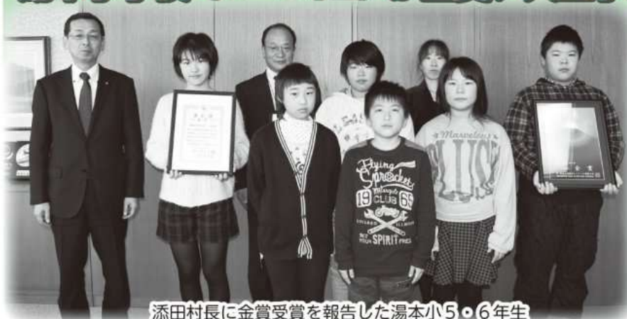
添田村長に金賞受賞を報告した湯本小5・6年生

同大会において、小学校の部で湯本小学校(5・6年生)が4年ぶり2回目の金賞を受賞し、12月3日(火)に村長への金賞受賞の報告が行われました。