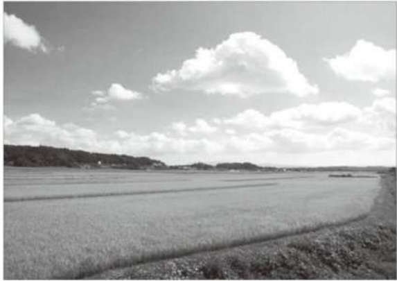
天栄のホッとする風景

(ブログ)「天栄・玉手箱」: http://ameblo.jp/tenei-tamatebako/