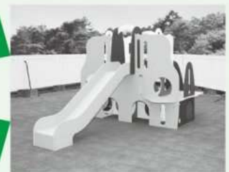
既存のジャングルジム、滑り台を滑り台付ジャングルジムへ統合して更新