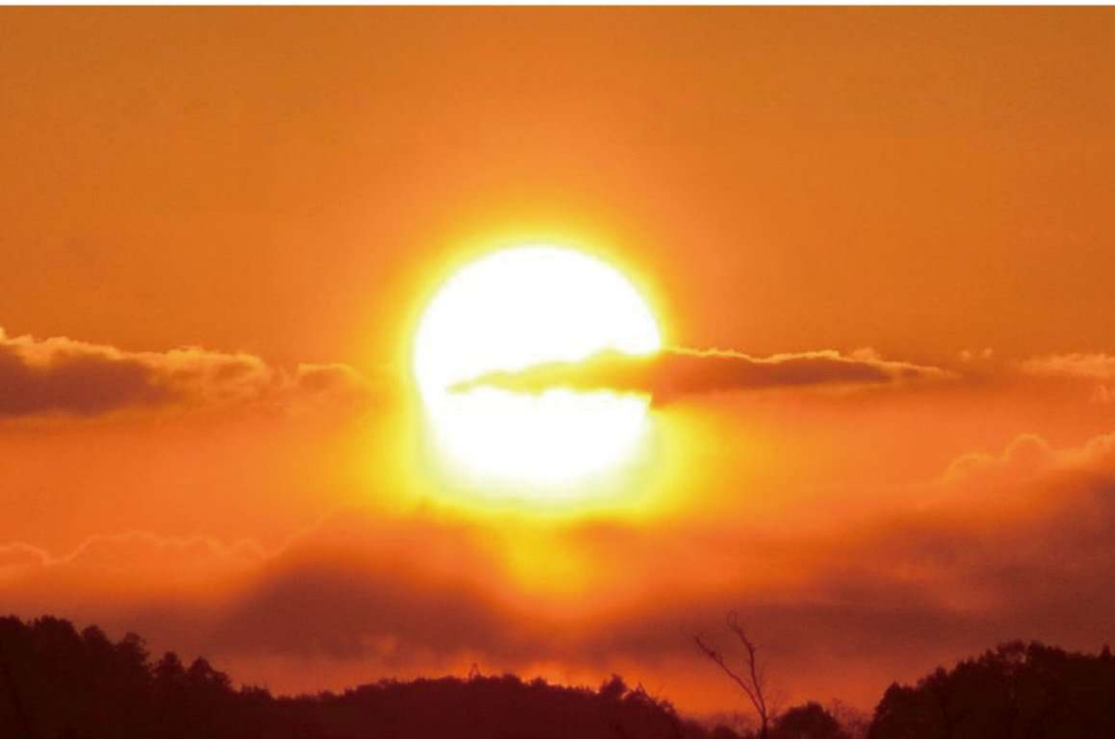
飯豊地区からの日の出