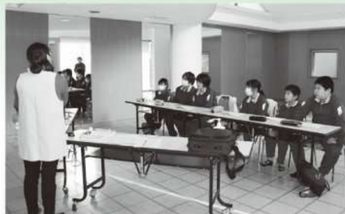
保健師から幼児の接し方などの説明を受ける児童