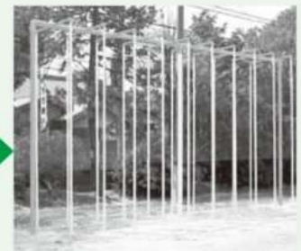
既存の登り棒を新しい登り棒へ更新