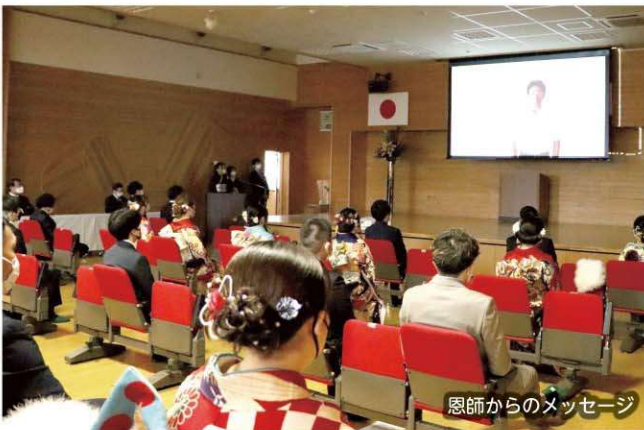
恩師からのメッセージ