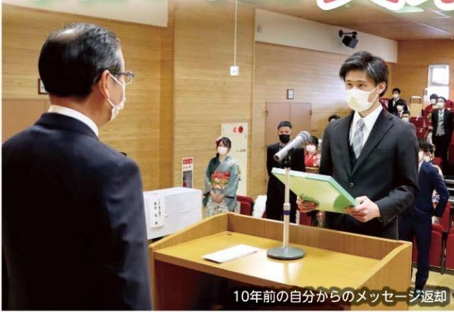
10年前の自分からのメッセージ返却