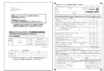
②接種券一体型予診票