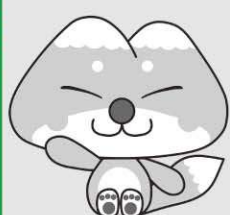
天栄村マスコットキャラクター ふたまたぎつね

車を譲った、車を下取りに出した、長年使っていない車が敷地内にある、車検が切れて乗っていない、引っ越しをしたなどのお心当たりはありませんか？