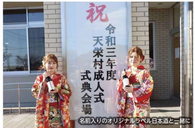
名前入りのオリジナルラベル日本酒と一緒に