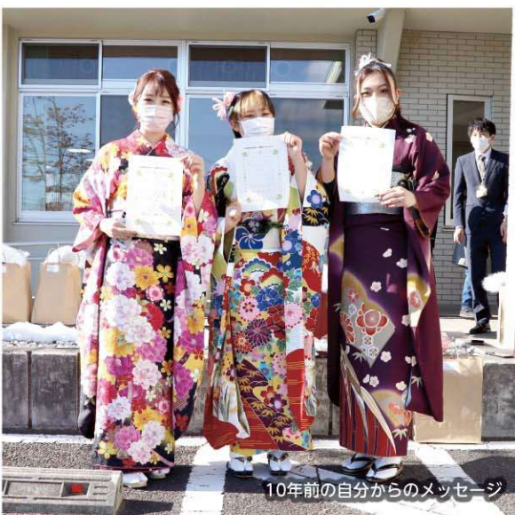
10年前の自分からのメッセージ

1月8日(土)、天栄村生涯学習センターにおいて、令和3年度天栄村成人式が行われ、64名が大人の仲間入りをしました。 今年度は新型コロナウイルス感染症の影響により夏の成人式が延期となり、昭和49年以来、47年ぶりの冬の開催となりました。 式では、成人者一人ひとりの名前が読み上げられ、成人証書と、村からの記念品として寿々乃井酒造店、松崎酒造の日本酒に新成人の名前を入れたオリジナルラベルの日本酒が新成人へ送られました。 また、添田村長からは「失敗を恐れず、何事にも挑戦してほしい」と挨拶があり、恩師の先生からのビデオレターでのお祝いメッセージや、成人者から村へ記念樹として桜の贈呈、10年前の自分からのメッセージ返却があり、成人式を迎えた新成人は、旧友との再会と人生の節目を喜び合っていました。