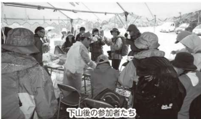
下山後の参加者たち