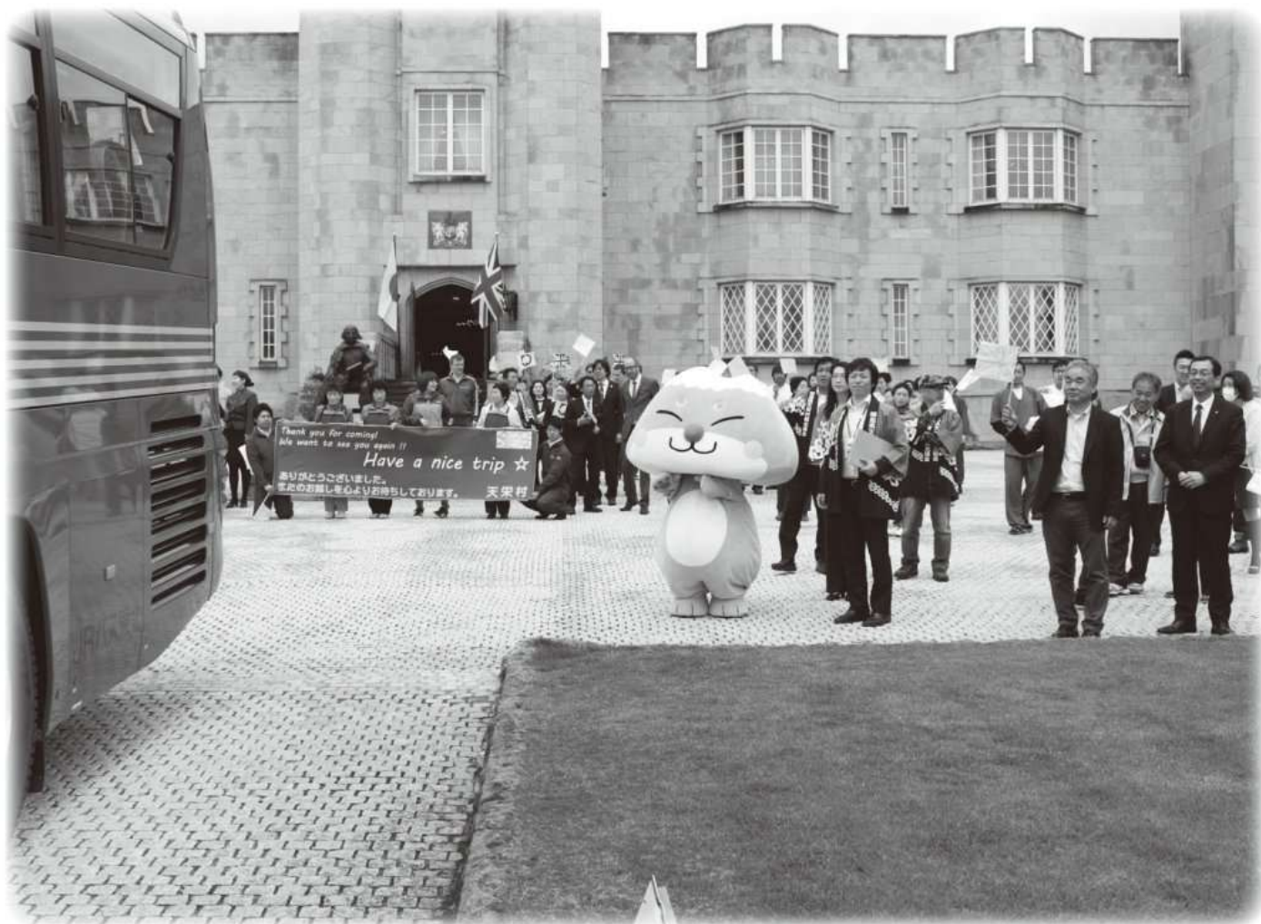
ふくしま観光キャンペーンで村の特色をPR（詳しくは3ページ）