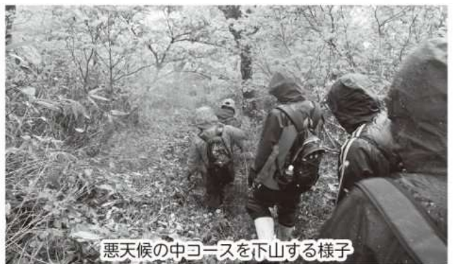
悪天候の中コースを下山する様子