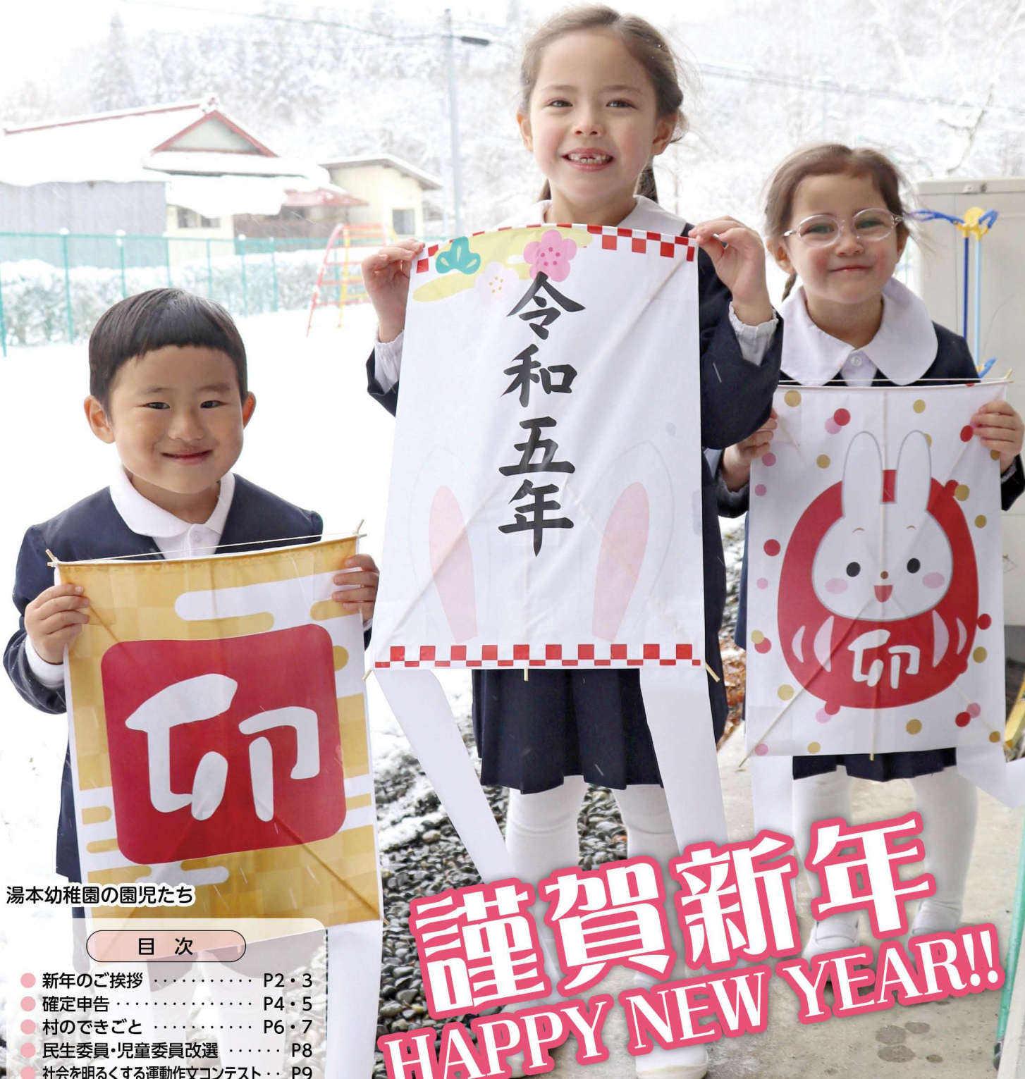
湯本幼稚園の園児たち