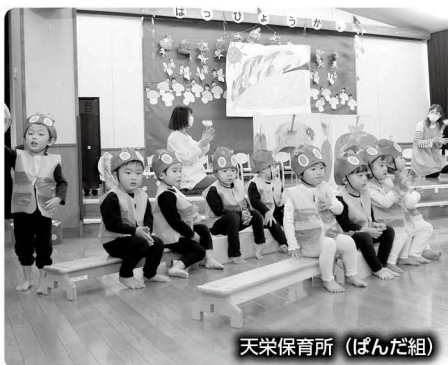
天栄保育所 (ばんだ組)