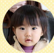
かぶき はな 蕪木 花凧さん