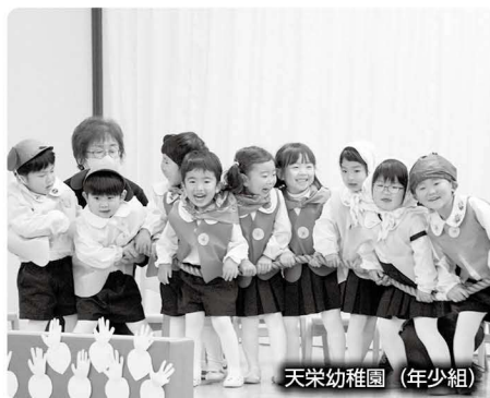
天栄幼稚園 (年少組)