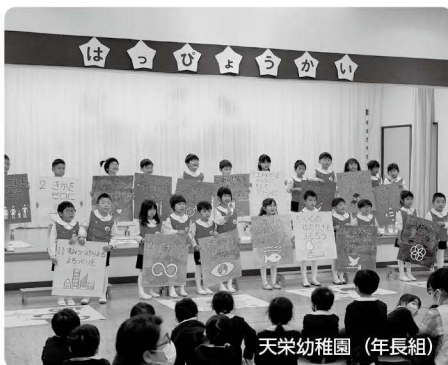
天栄幼稚園 (年長組)

12月16日(金)には、湯本幼稚園でクリスマス発表会が行われ、少人数ながら元気に歌や劇を披露し、親子でゲームなどをして楽しい時間を過ごしました。