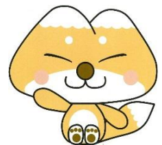
天栄村マスコットキャラクター ふたまたぎつね

協力: 天栄村観光協会、天栄村商工会、二岐温泉旅館組合、岩瀬湯本温泉旅館組合、羽鳥湖高原ペンション組合、二岐温泉事業協同組合、てんえい山の会、須賀川地区交通安全協会湯本分会、福島森林管理署白河支署、須賀川警察署湯本駐在所、須賀川消防署長沼分署湯本分遣所