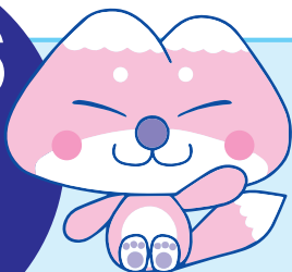
天栄村マスコットキャラクター「ふたまたぎつね」