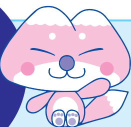
天栄村マスコットキャラクター「ふたまたぎつね」