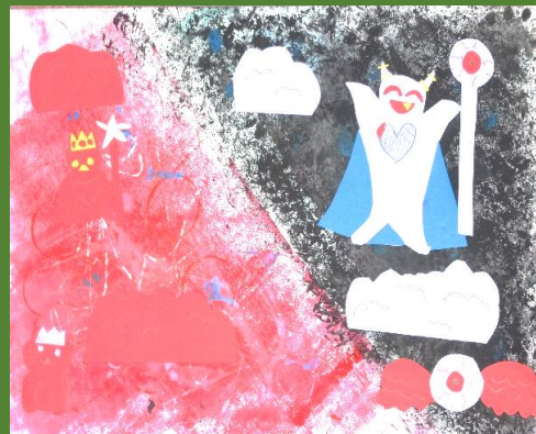
「ほのぼのけっとう」