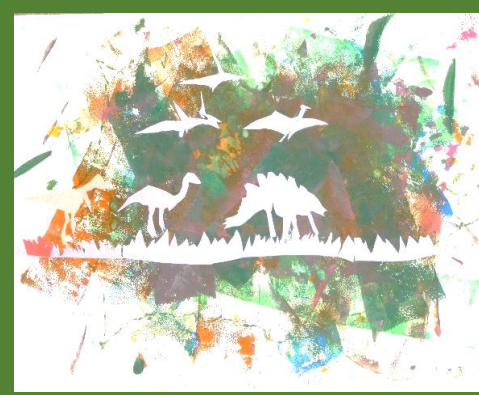
「けむりの中のきょうりゅう」