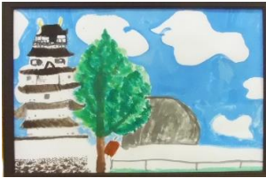
「見学学習で見た鶴ヶ城」