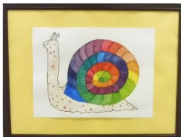
「レインボーかたつむり」