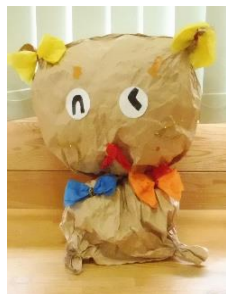
「リボンねこちゃん」