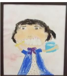
「なつやすみもみがきます」