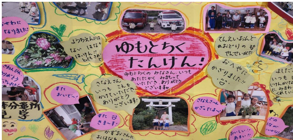
★湯本幼稚園 「湯本地区探検」