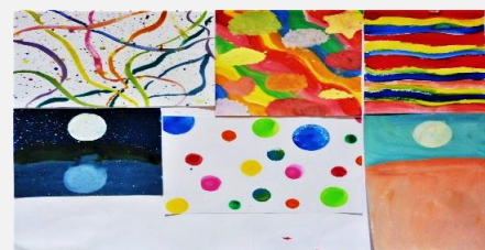
5年『いろいろな気持ち』