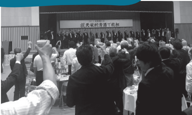
体育館に響く乾杯の声