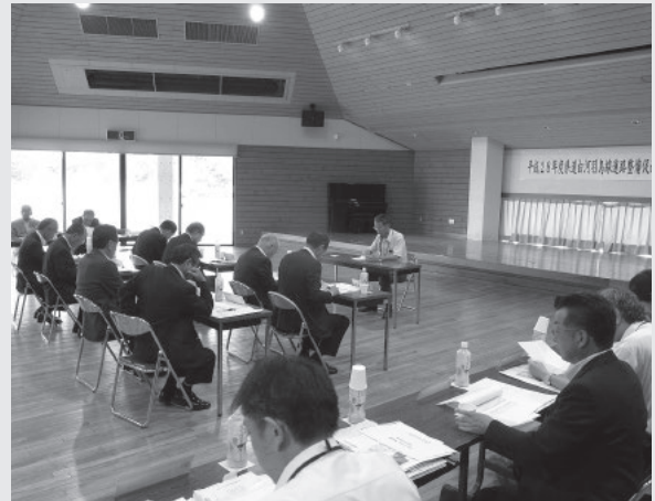
整備促進のために審議中

総会の中では、真名子峠の改良整備の促進や羽鳥湖周辺の早期整備の推進を事業計画に定め、要望活動や環境美化活動により、引き続き整備促進に尽力していくこととしました。