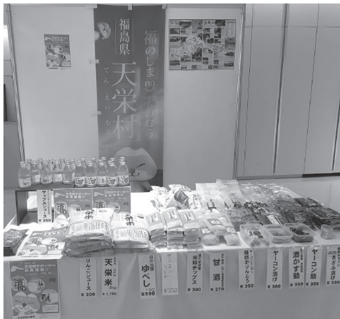
物品販売によるPR活動

村といたしましては、風評被害の払拭対策として関係機関と連携し、福島県産品の安全・安心をアピールして参りました。さらに、岩瀬管内市町村長とJAが合同でトップセールスを継続的に実施しております。いまだに風評被害は一部、根強く残っており、風評払拭にはこれといった即効性のある方策は