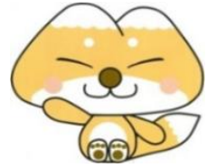
天栄村マスコットキャラクター ふたまたぎつね