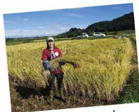
今年はおいしく できたでしょうか！