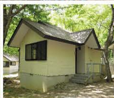
左/管理棟ではキャンプ用品をレンタル&販売している 中/テントサイトで楽しくバーベキュー 右/10棟