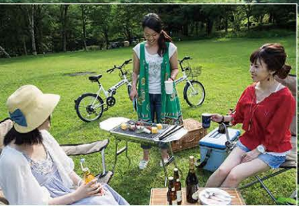
屋外バーベキューで日帰り滞在ももちろんOK！