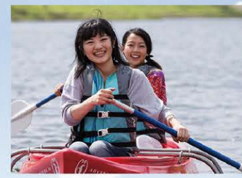
左/アウトリガー付きなので初心者でも扱いやすいカヌー。ペットと一緒に乗れる。下/レンタルもできるルアーフィッシング