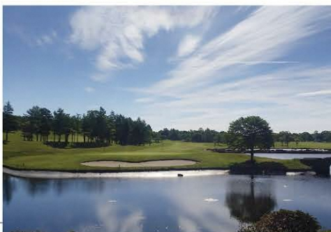
晴れば白河市街から筑波山が見え、岬の突端にいるかのような開放感を得られる

「メドウ」は英語で牧草を指す言葉。軍馬の放牧場だった地を、もとの地形や天然林を生かしたまま設計したコース。林でコースがセパレートされているので、戦略性に富むリゾート向けコースながら初心者からエキスパートまで楽しめます。