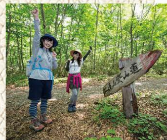
二岐山へのトライ！に 気合い充分のハイカー

巨人伝説が残る二岐山は、平家の落人のものがたりも伝わる神秘的な山。ブナ林に覆われる行程5時間程のルートは初級者でも楽しめます。周囲の名峰をぐるりと眺望できます。頂上からのビューは県下随一といっても良さそうです。 ユニークなルートを紹介する地元グループのサイトもあり、楽しみ方は無限大。気軽な夏のアクティビティからちよつとマニアック？な山遊びまで、二度、三度と訪れたくなる懐の広い天栄村の大自然は、地域の大切な宝なのです。