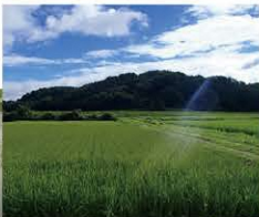
雀も米のできが 気になるようです (笑)