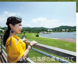
涼やかな高原の風を浴びて