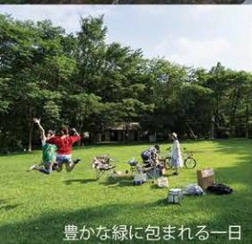
豊かな緑に包まれる一日