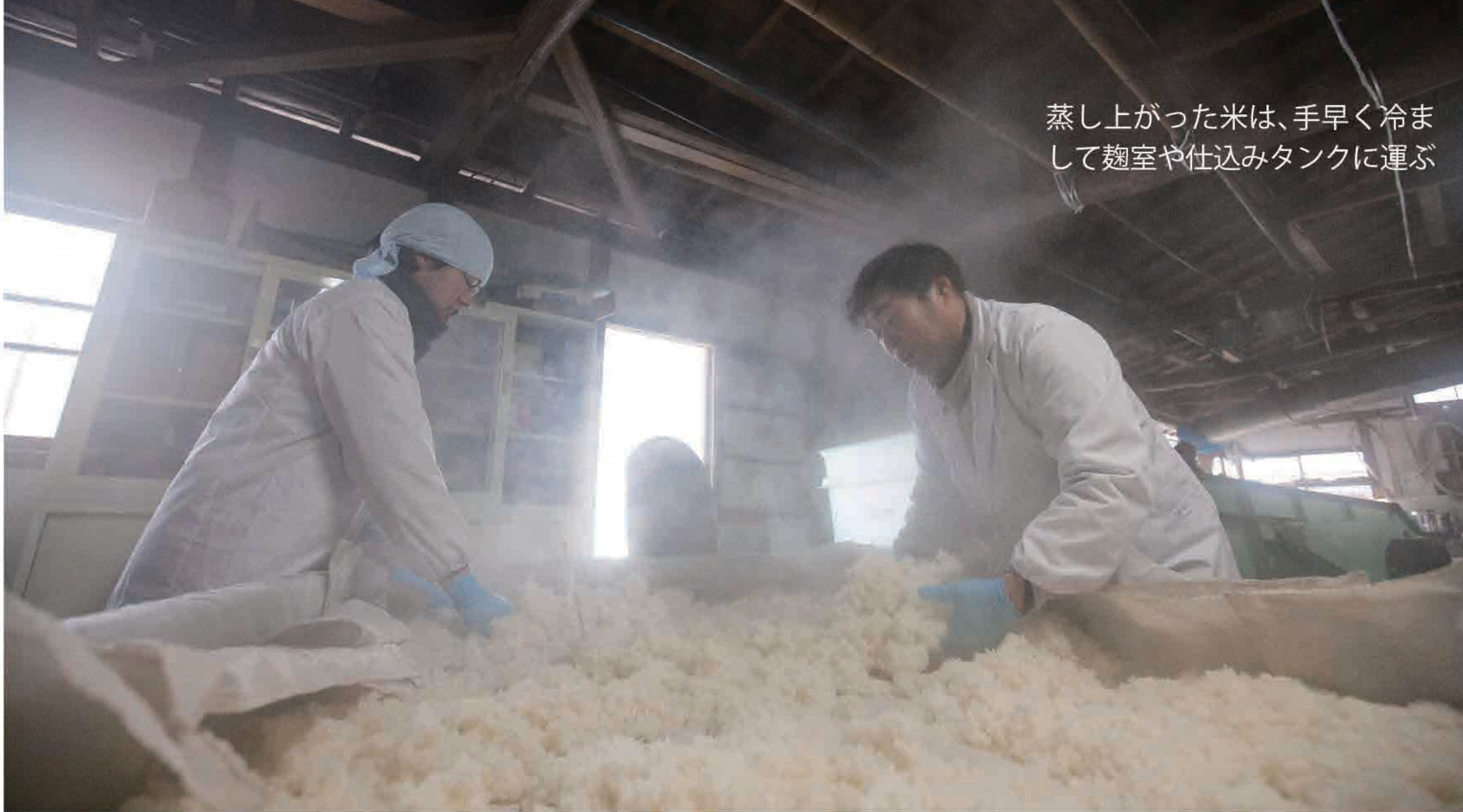
蒸し上がった米は、手早く冷まして麴室や仕込みタンクに運ぶ