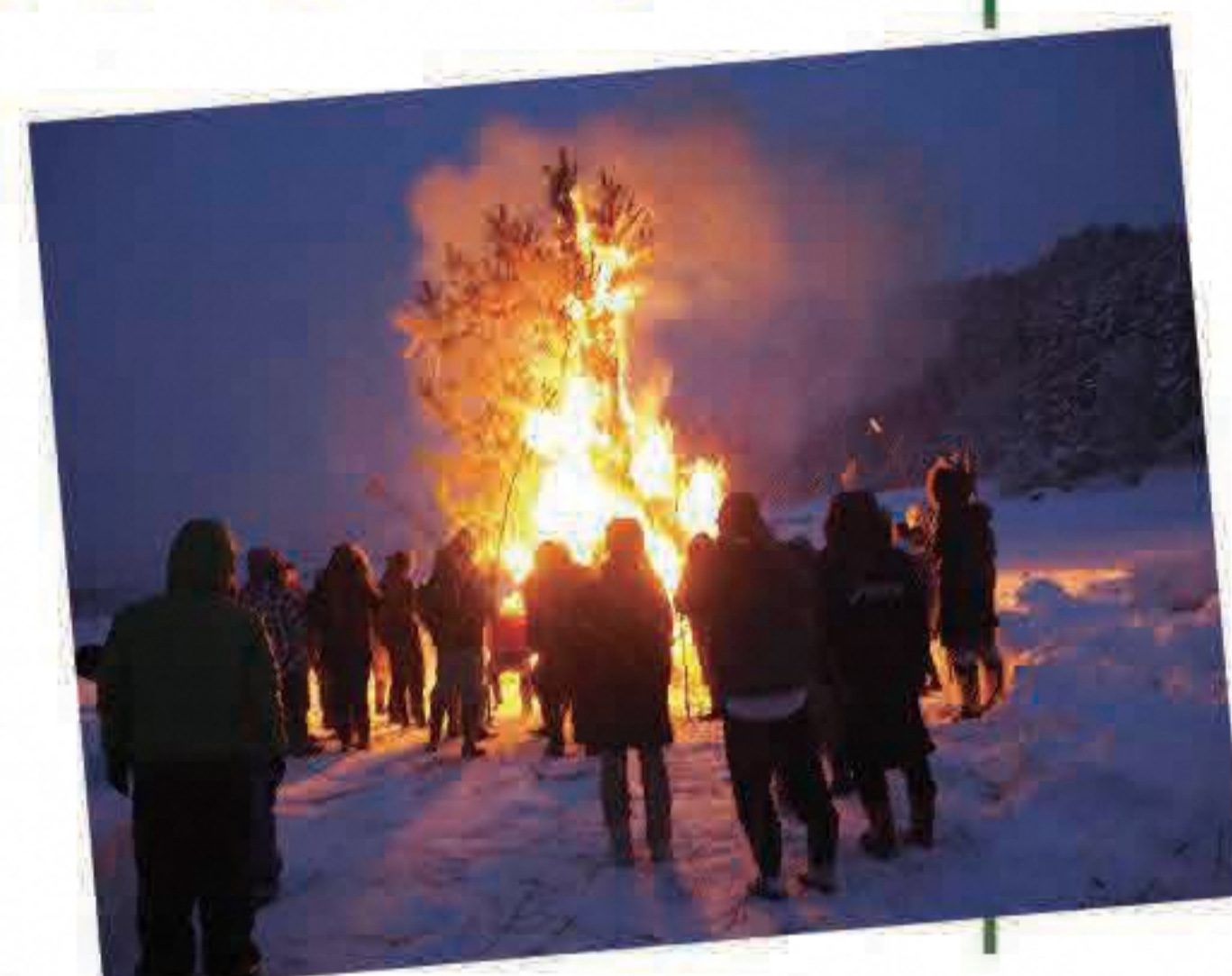
小正月といえば 家内安全を祈願する どんど焼き!