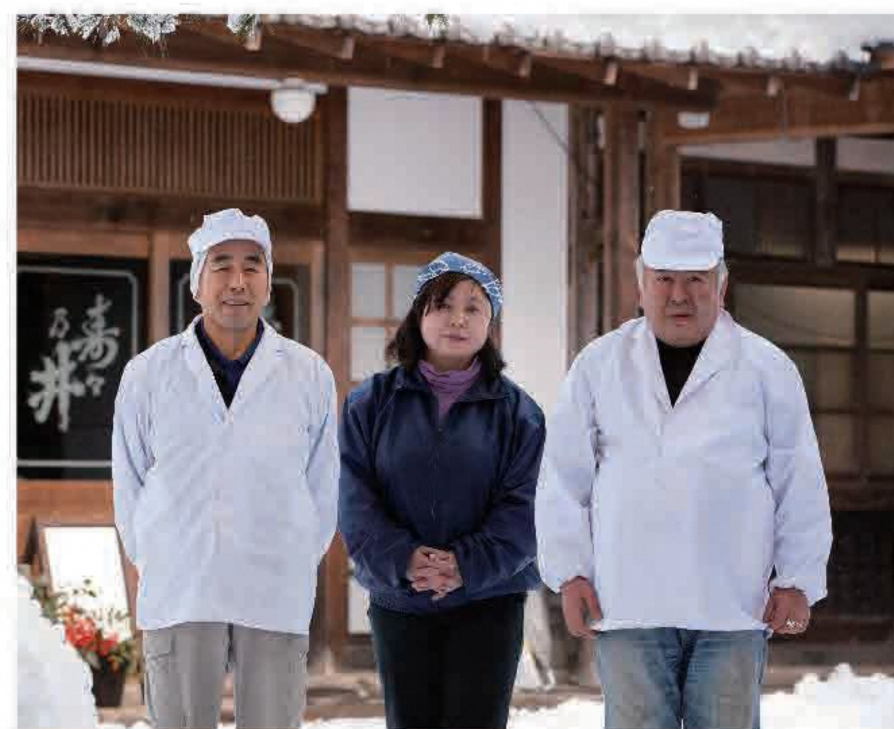
寿々乃井酒造店 天栄村大字牧ノ内字矢中1 TEL.0248-82-2021 9:00~17:00 | 無休