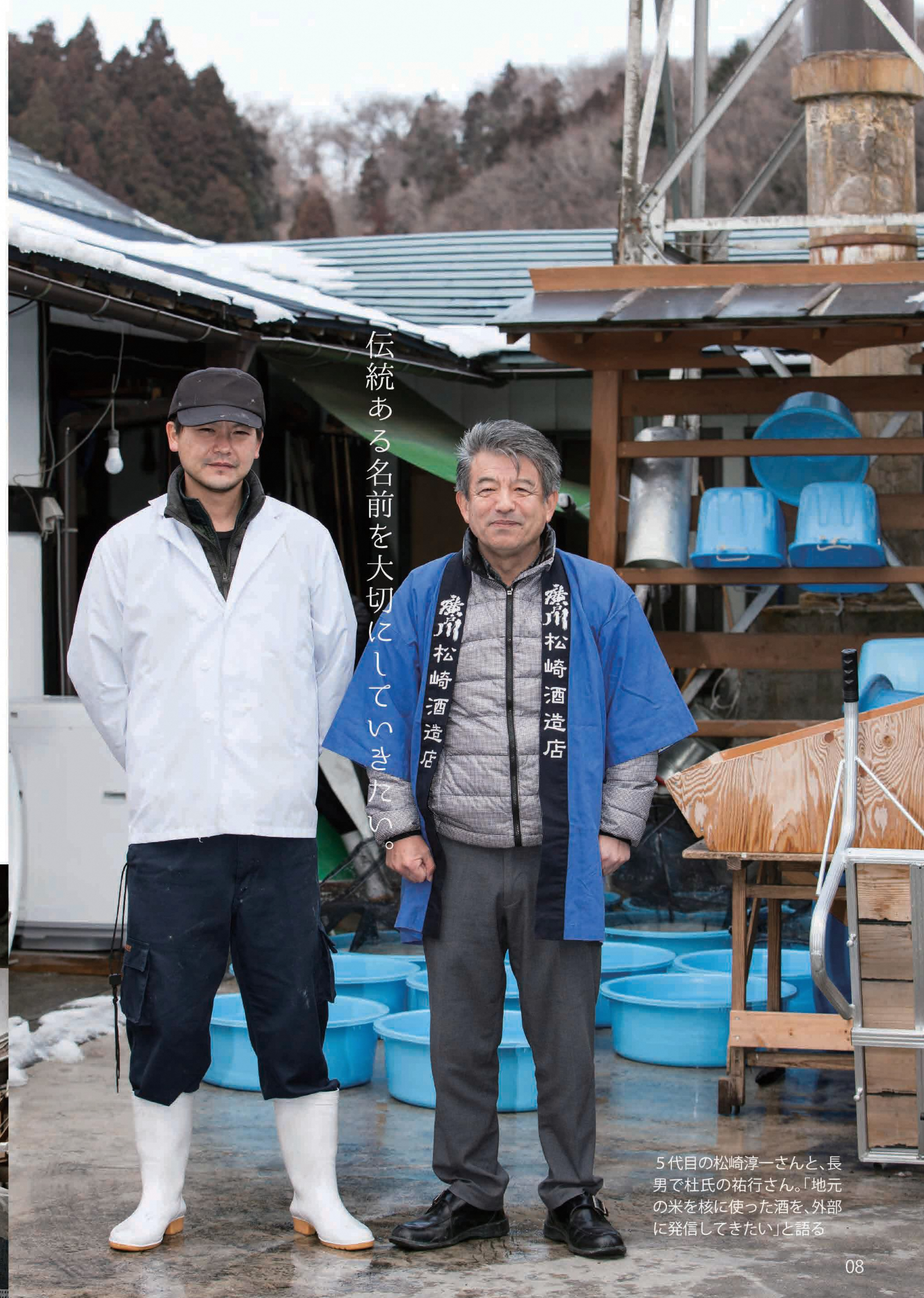
伝統ある名前を大切にしていきたい。