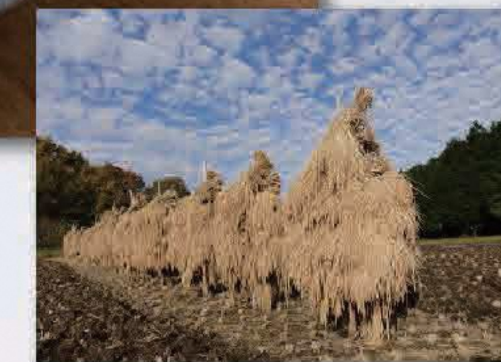
昔ながらの はさ掛け乾燥です