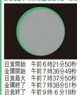
役場付近での欠け具合と見え方・時間

肉眼で直接太陽を見ると、たとえ数秒であっても目を痛めてしまいます。また、物を通すことであまり眩しく感じなくても、目に有害な波長の光を受けてしまい、気づかないうちに網膜を損傷してしまう危険があります。特に、子供が一人で観察することがないように、大人が十分注意してあげてください。