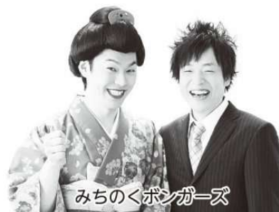
みちのくボンガーズ