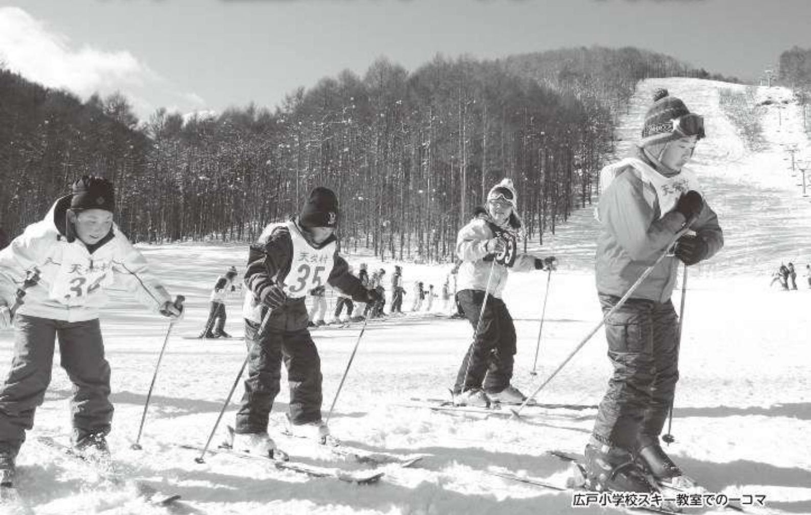
広戸小学校スキー教室での一コマ