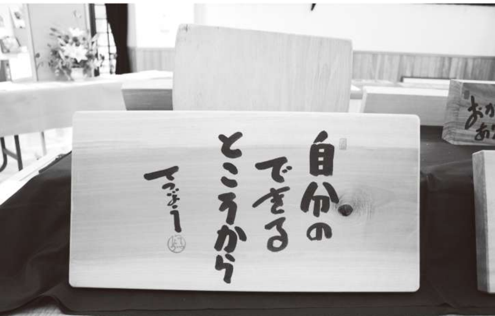
村ふるさと文化伝承館企画展「大谷徹笑 書の世界～大日堂コレクションから」より (※現在企画展は終了しています。)