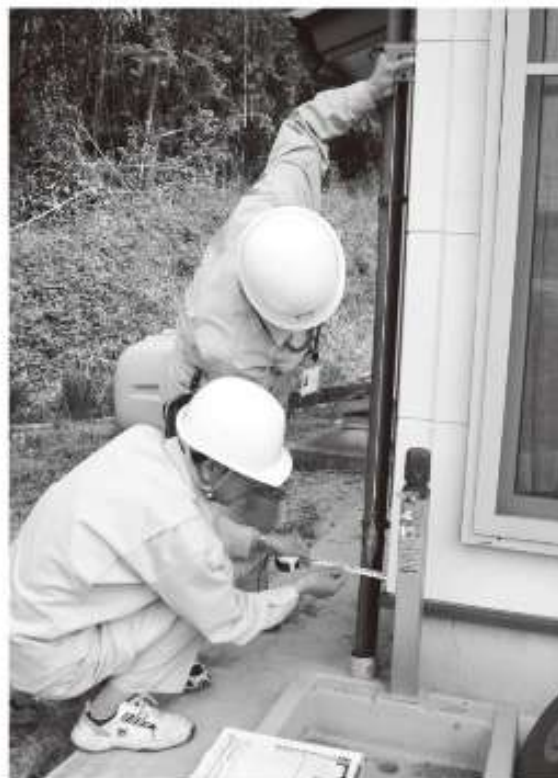
△下げ振りで、住家の傾きを計測しています。