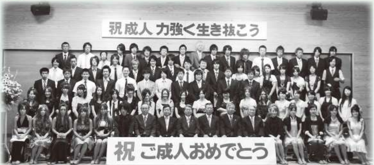
※ 写真は平成 22 年度の様子