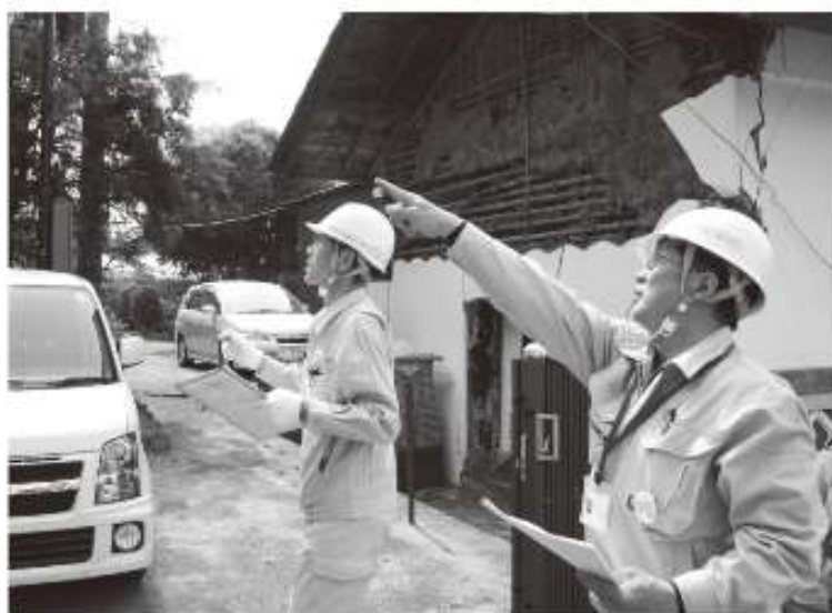
△屋根、外壁、基礎部分などの外観を目視により確認

現在調査班は、作業を正確かつ早急に進めており、6月10日頃には調査対象の全ての認定調査を終える予定です。