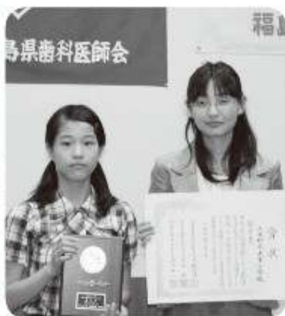
福島県歯科医師会

※応募校102校のうち、小学校(11学級以下)の部「優秀賞」全8校の中で県中地域中唯一の受賞となり、昨年度に引き続き2度目の快挙となりました。