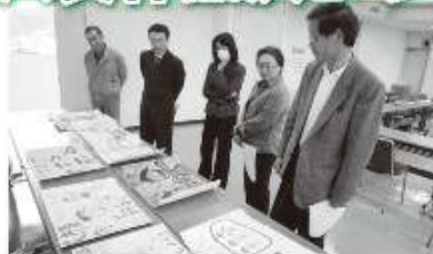
【平成 23 年度 “社会を明るくする運動” 作品コンテスト入賞者】