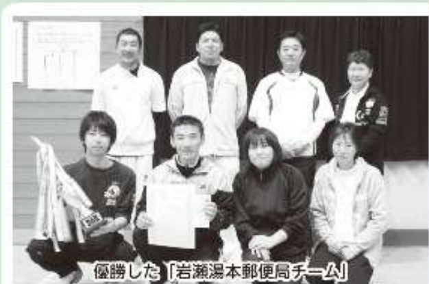
優勝した「岩瀬湯本郵便局チーム」

10月19日（水）湯本体育館で、湯本公民館主催の第40回湯本地区職域親善バレーボール大会が開催されました。 この大会はバレーボールをとおして健康の増進と地域職場間相互の親睦を図ることを目的として開催されたもので、全9チームが出場しました。 試合は終始なごやかな雰囲気の中、激戦もあり、攻撃力に勝った岩瀬湯本郵便局チームが優勝をおさめました。