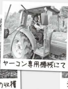
ヤーコン専用機械にて