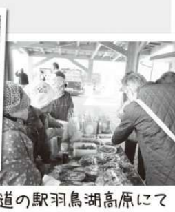
道の駅羽鳥湖高原にて