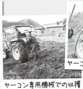
ヤーコン専用機械での収穫