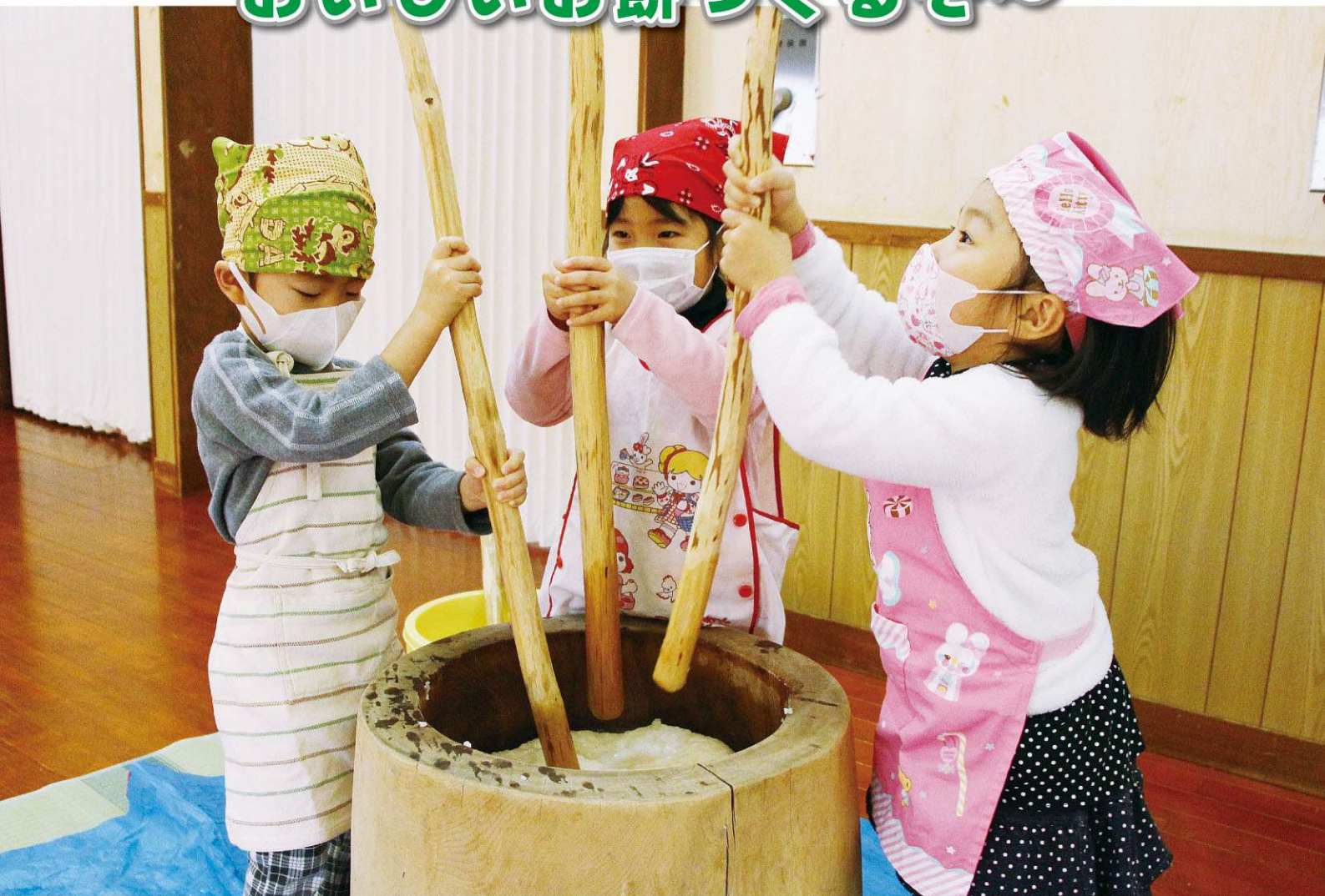
湯本保育所もちつき大会の一コマ