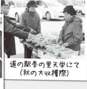
道の駅季の里天栄にて (秋の大収穫祭)

(ブログ)『天栄・玉手箱』: http://ameblo.jp/tenei-tamatebako/