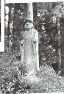
栄林寺の子授け地蔵