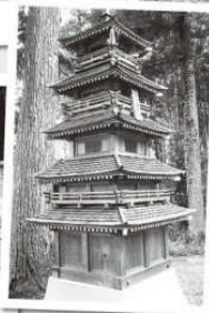
←若宮八幡神社の五重塔