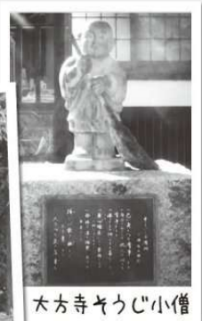
大方寺きょうじ小僧

(ブログ)『天栄・玉手箱』: http://ameblo.jp/tenei-tamatebako/