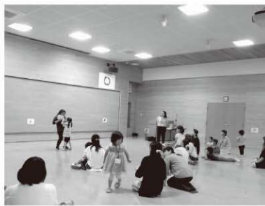
幼児と親の英会話教室