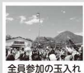
全員参加の玉入れ

昔ながらで懐かしいけれど、新しい風が吹いている湯本地区合同大運動会でした。私自身、とても楽しませて頂きました。また来年もお伺いしたいです。