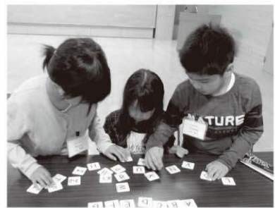
小・中学生の英会話教室