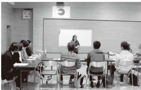
大人の英会話教室