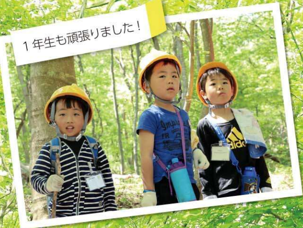
1年生も頑張りました!