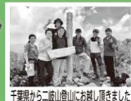
千葉県から二岐山登山にお越し頂きました

天栄村の大自然の良さを、より多くの方に知ってもらう為、地域おこし活動により力を入れていきたいと思っています。