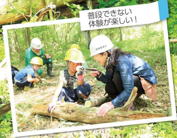
普段できない 体験が楽しい!