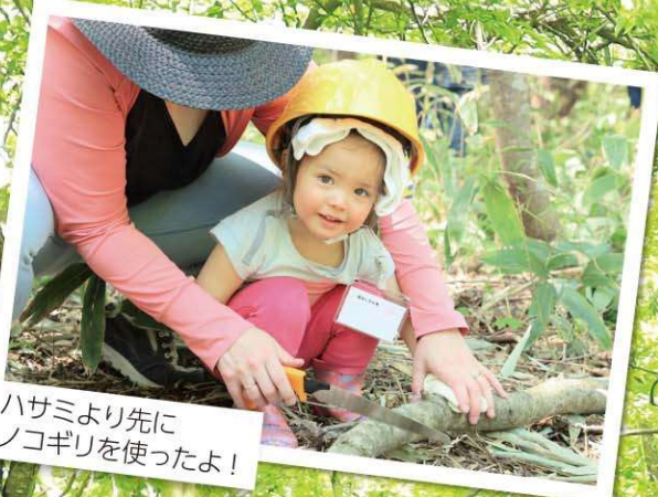
ハサミより先に ノコギリを使ったよ!