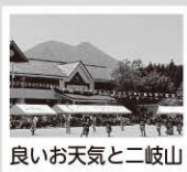
良いお天気と二岐山