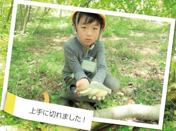
上手に切れました!