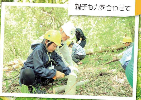
親子も力を合わせて