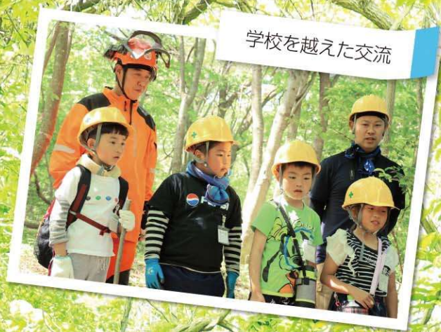
学校を越えた交流