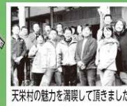
天栄村の魅力を満喫して頂きました

紅葉の見どころの時期には、以前私が活動の一環として、千葉県で天栄村のPRをした際に興味を持たれた方々が、天栄村に観光旅行でお越しになり、紅葉狩りや温泉、観光地巡り、釣りなどをして、村の魅力を満喫されました。これからはウィンターシーズン!引き続き、首都圏に向けたPRを頑張りたいと思います!