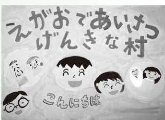
▲黒澤 陸さん(牧本小5年) 清浄 遥加さん(天栄中2年) ▶