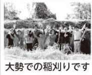
大勢での稲刈りです

干した稲は、台風19号によりさでがけが一列倒れてしまいました。まだ田んぼの水が引かない中、駆けつけてくださった周囲の方々の手を借りて再度さでを組み、稲を水から引き上げてけなおしました。稲刈りから2週間以上もかかって玄米となった時は「やっとできた!」と安堵しました。沢山の方に助けて頂いて出来たお米ですので、例年以上に一粒一粒、感謝しながらいただきます。