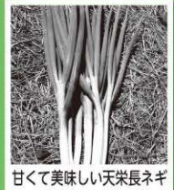
甘くて美味しい天栄長ネギ

村の特産品の甘くて美味しい天栄長ネギ、その中でも生産量が福島県内トップクラスの夏ネギ（6月から9月に収穫される）の種まきをされていたので、生産者さんのお手伝いに行ってきました。私は培土作業をし、生産者さんは種まき作業を一貫して丁寧に作業されていました。そして種まき作業が終わると休む間もなく収穫作業のお手伝い。甘くて絶妙な柔らかみのある天栄長ネギを食卓に届けようと、忙しく動く生産者さん。私もお役に立ちたいとフル回転でお手伝いさせて頂きました。