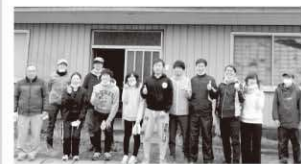
12月に活動したメンバー

12月下旬、天栄村に度々来てくれている“NPO 法人きたまる”に所属する首都圏の大学生による新しいプロジェクトが始まりました。田良尾の空き家を再生し、大学生が地域活動をするための拠点と、地域の人たちと交流できる場所を作ろうという計画です。空き家所有者との契約や集落の方への説明会を経て、まずは空き家の内部の片付けを行いました。私も大学生や地元湯本塾に混ざって参加させて頂きました。片付けでは集落の方もお手伝いや差し入れなど応援に来て下さっていて、大学生がすでに地域に受け入れてもらっていると感じました。