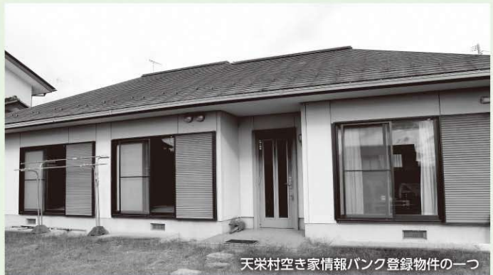
天栄村空き家情報バンク登録物件の一つ

昨年度より本格的に空き家情報の提供をスタートしたところ、天栄村に住みたいという問い合わせが県内外から多く寄せられるようになりました。