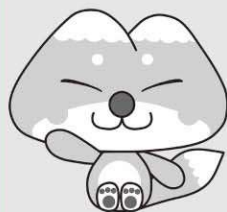
天栄村マスコットキャラクター ふたまたぎつね