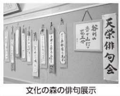
文化の森の俳句展示

新型コロナウイルス感染症の影響で活動を自粛していた俳句会は、6月から再開しました。換気の為に窓を開けて句会をしていると、鳥の音が聞こえて風流さも感じます。