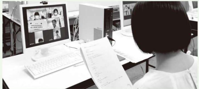
成人式実行委員会・オンライン会議の様子

村では新成人者で組織する成人式実行委員会と共にオンライン会議等を行い、新型コロナウイルス感染症に対応した成人式の開催方法について検討してきました。