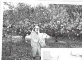
← 稲ご収穫 (12月)