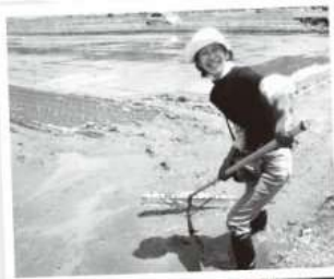
↑ 田植えにて (5月)

この一年間、地域おこし協力隊としてあらゆる活動を通して、天栄村のたくさんの魅力を発見することができました。特に震災以降、新たな取組みを積極的に行う姿勢には心から感銘を受けました。天栄村で再度暮らせること、豊かな自然環境のもとたくさんの温かい方との関わりが日々あることに本当に幸せを感じます。そんなみなさんのために、自分にできることは、ごく僅かではありますが、特に今後も村民の方々の産業を通して、みなさんの真摯に取り組む姿や村の魅力を一人でも多くの方に伝えることができたらと思います。これからもよろしくお願い致します。