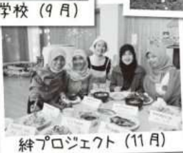
絆プロジェクト (11月)