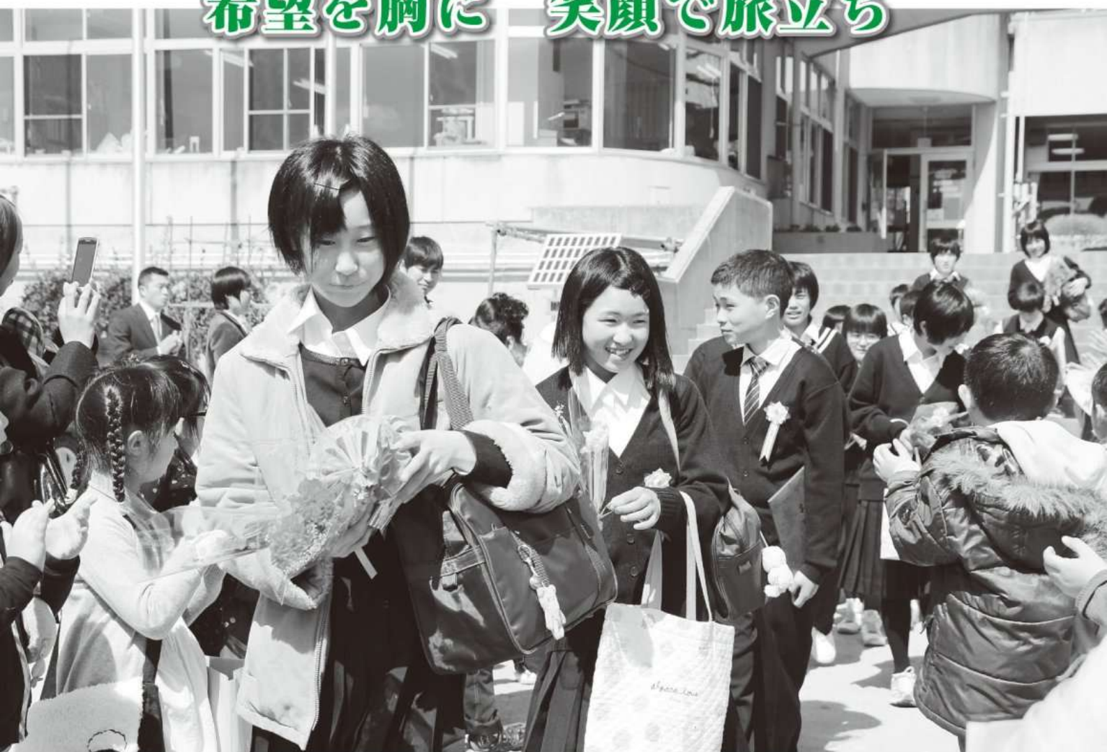
卒業式終了後に見送られる卒業生（牧本小学校）