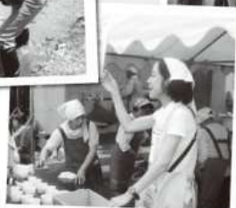
羽鳥湖高原ウオーク (7月)