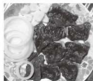
deer's meat (鹿肉)