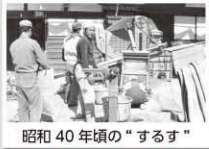
昭和40年頃の“するす”

今年度、昔の写真を集めているなかで、昭和40年頃の“するす”の写真では、大きな籾摺りの機械が庭にあって、女の人が籾を運び、男の人が玄米を袋詰めして家族総出の大仕事だったことが分かります。