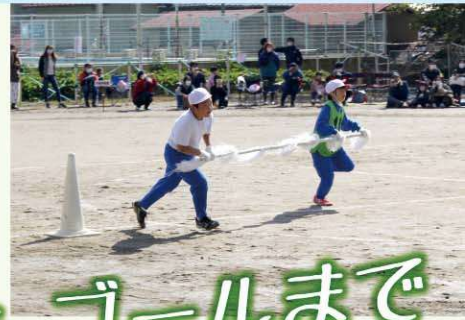
運動会 輝く姿をゴールまで