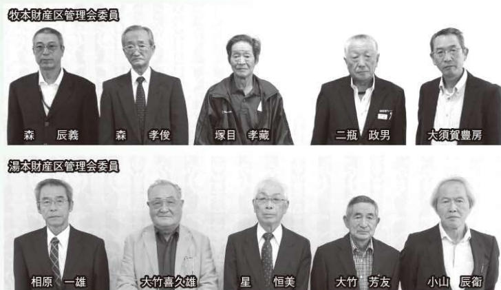
牧本財産区管理委員会

各地区から推薦され、令和2年9月天栄村議会定例会において同意を得た、牧本財産区管理委員会・湯本財産区管理委員会の方々に10月5日（月）、辞令が交付されました。任期は令和2年10月1日から令和6年9月30日までの4年間で、委員は次の方々です。