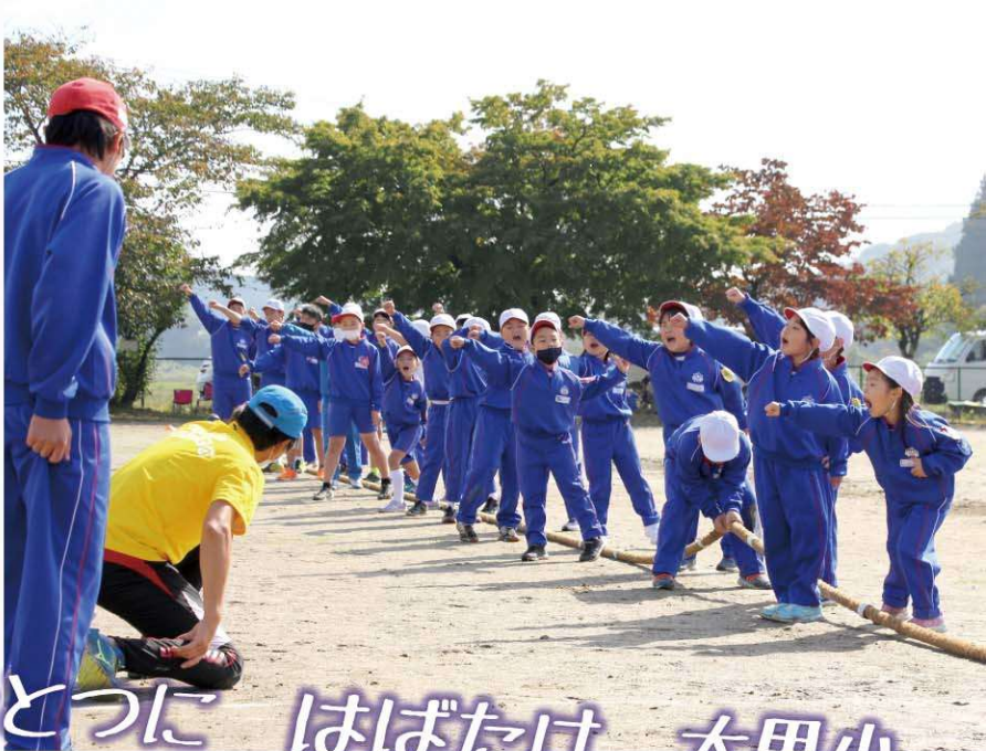
心をひとつに はばたけ 大里小