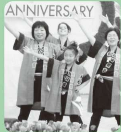
2012年鏡石のオランダ祭りでデビューしました！