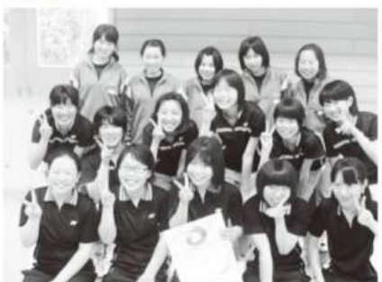
天栄中学校バドミントン部の選手

5月に行われた岩瀬支部中体連総合大会を勝ち抜いた村内中学生たちが、6月12日(土)開催の県中地区予選大会において日頃の練習の成果を発揮し、優秀な成績をおさめました。