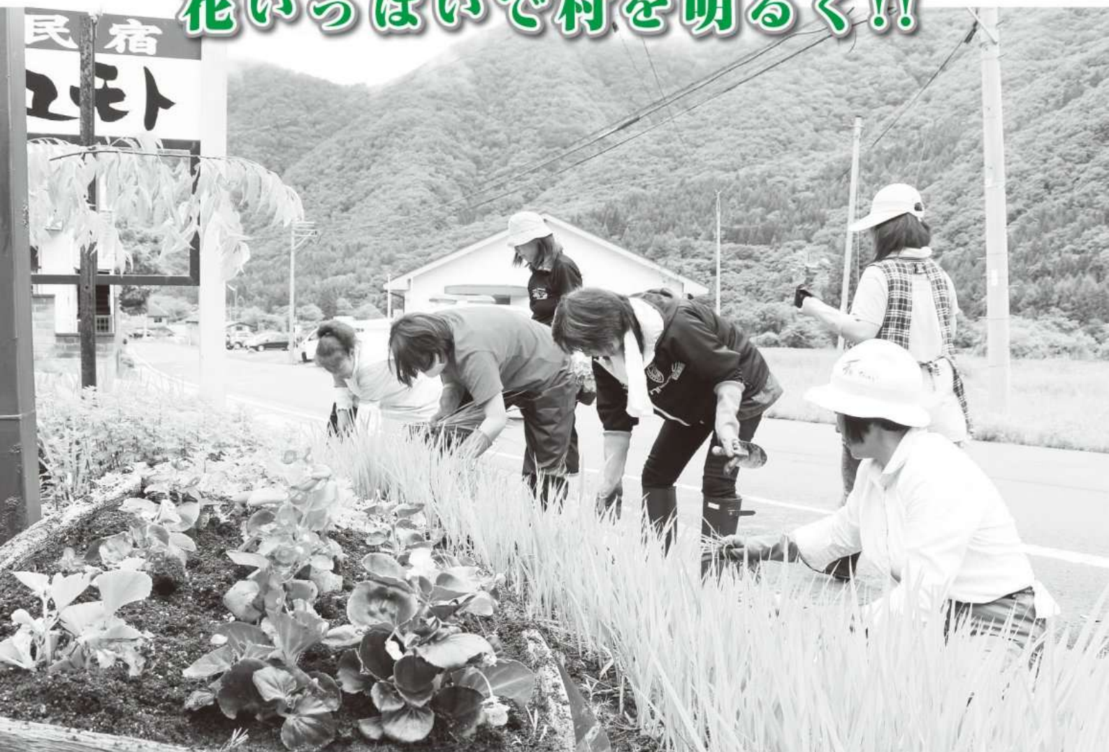
天栄村商工会女性部による花いっぱい運動の様子