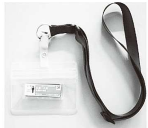
バッジ式個人線量計

また、へるすびあでは、自分で積算線量を確認することができる「電子式積算線量計」の貸出しを行っています。希望される方は、へるすびあまでご連絡ください。