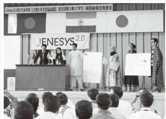
各国代表のプレゼンテーション