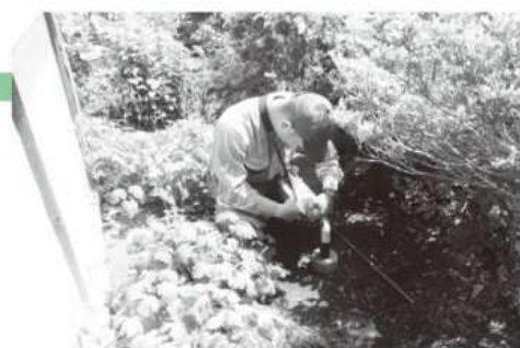
放射線量の測定の様子

天栄村ホームページ http://www.vill.tenei.fukushima.jp/