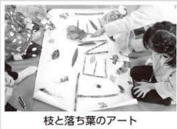
枝と落ち葉のアート

季節を感じられるものとして、10月下旬に湯本地区で開催された湯本しぜん塾と天栄アクティビティクラブの森あそびでは、落ち葉拾いをしました。ただ落ち葉を集めるのではなく、種類ごとに点数が決まっているチーム戦です。松ぼっくりや葛など見つけやすいものは1点・2点、森の中に1本しかないシラカバの葉は高ポイントです。子供たちは広い森の中で探すなかで、足元の大量の落ち葉にもそれぞれ名前があると学んでいたようです。後半は、拾った落ち葉や切った枝でチームごとに「天栄」を表現しました。こちらは村の文化祭でも展示しました。子供たちにとっても行事が少なかった1年の中で、秋の思い出として心に残ればいいなと思います。