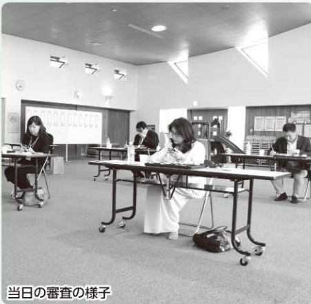
当日の審査の様子