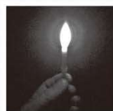
candle in the dark

ですから、困難な状況に直面したときはいつでも落胆しないでください。代わりに、戦います。勇気を持って。時々、私たちは自分の長所と短所を知るために暗闇の中を歩く必要があります。時々、私たちは暗闇の中を歩いて、私たちの道を照らす希望があることを確認する必要があります。