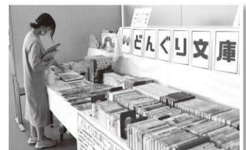
文化祭でも展示し、たくさんの方が本を引き取ってくれました!