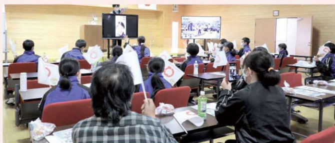
生涯学習センターと各中継所を繋いでビデオ通話を利用したリモートでの選手激励