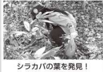
シラカバの葉を発見!

今年も残り1か月となりました。新型コロナウイルスの影響で行事やイベント等が中止になり慌たしさが少なかったはずなのに、例年より1年が過ぎるのが早いと感じています。季節毎の行事は、暮らしのリズムを作っていたのだと改めて感じています。