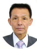
太多郎区 くるまだ ただし 車田 忠志