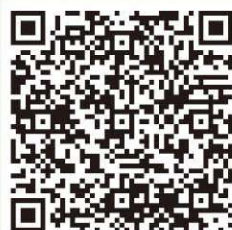
村 HP はぴ福なび補助サイト