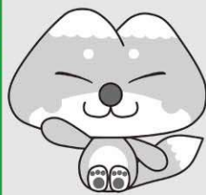
天栄村マスコットキャラクター ふたまたぎつね