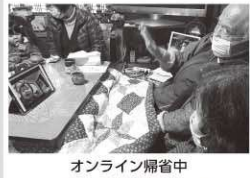
オンライン帰省中

さて、今年はお客様も少なく静かなお正月となったご家庭も多かったのではないのでしょうか。私は県南の実家で過ごしました。昨年までは親戚が集まって大変賑やかでしたが、今年は感染症対策で帰省客もなく、室内でもマスクをしながら過ごしました。そんな中、何度か仕事でも使用しているインターネットを使った会議ツール「Zoom」で、東京に住む姉家族がオンライン帰省をしました。小さなタブレットの画面越しでも、子ども同士・親同士が会話を楽しみ、そして特に1年ぶりにひ孫の成長を見られた曾祖父母が喜んでおり、「いやはや、すごい時代になったな」と言っていたのが印象的でした。私自身も数年前までは、ビデオ通話をこんなに気軽に使うようになるとは思っていませんでした。コロナ禍を経験して仕事でも家庭でもオンラインの可能性が広がっていると感じたお正月となりました。