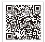
フォトコンテスト ホームページ