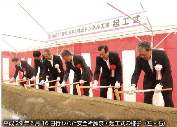
平成29年6月16日行われた安全祈願祭・起工式の様子(左・右)