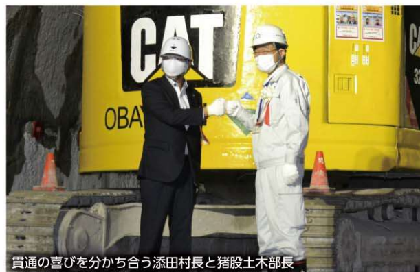
貫通の喜びを分かち合う添田村長と猪股土木部長