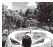
Yang-Suching - my friend in Taiwan

屋内での活動や、家の庭に膨らませたプールを設置したり、バーベキューをしたり、冷たい飲み物やフレッシュジュースを飲んだりするなどの活動は、暑さをしのぐための優れた代替手段であり、安全な方法です。コロナ禍の中でこの夏を楽しむための何か面白くて楽しい他のアイデアはありますか？