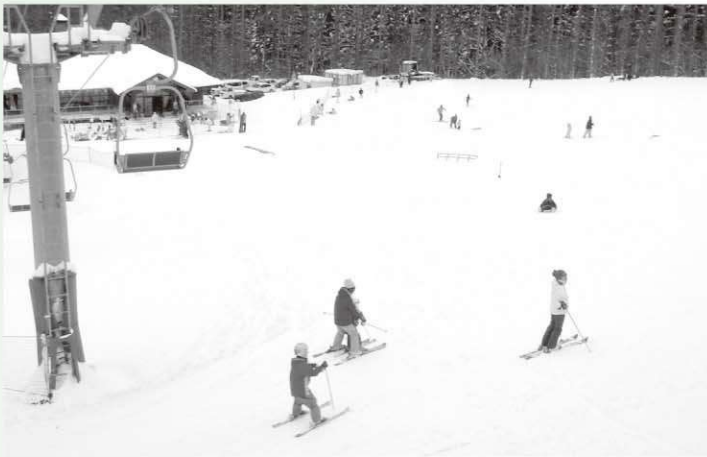
◆産業課商工観光係 ☎82-2117

また、村内小・中学校の児童、生徒ならびにその保護者が同スキー場を利用する際のリフト料金の補助を予定しております。詳しい内容については、別途お知らせいたします。