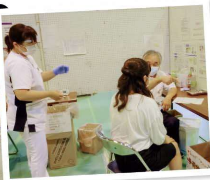
◀▲集団接種会場の様子