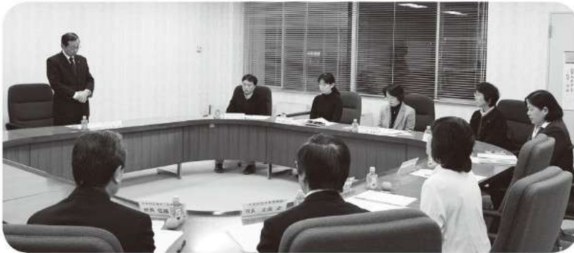
《天栄村子ども・子育て会議委員》