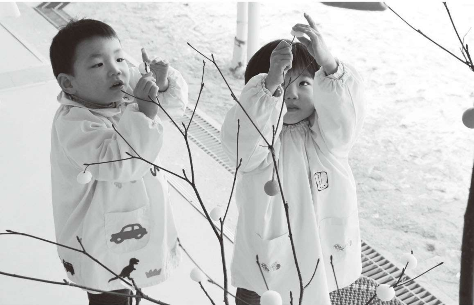
天栄幼稚園での団子さしの様子