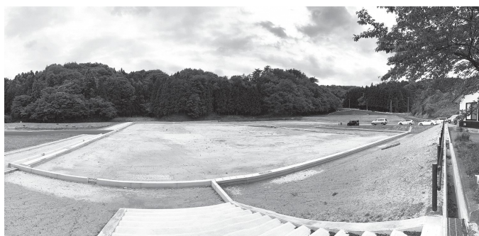
整備が進むふるさと公園整備事業（道の駅季の里天栄）

者とそれぞれの受注率と各業者名、村の工事の請負金額について、3千万円まで、5千万円まで、1億円まで、1億円以上に分けて、過去5年間分を分かりやすく一覧表にして伺いたい。