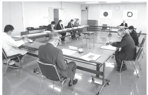
5月に開催された国民健康保険運営協議会

村は積立基金を活用して国保税の引き下げをするべきと思いますが、次の点について伺いたい。