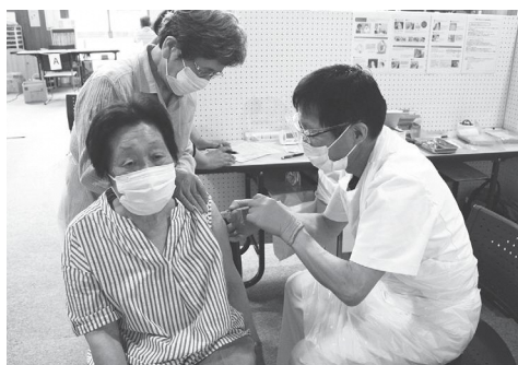
高齢者接種の様子（本庁管内）

新型コロナウイルスワクチン接種への対応につきまして、本村においては、関係機関のご協力により、去る5月26日から、高齢化率の高い湯本地区より、65歳以上の方々を対象とした「高齢者接種」を開始し、現在、湯本地区の対象者の1回目の接種が終了いたしました。2回目の接種は、来週16日から行い、本庁管内につきましては、6月30日から実