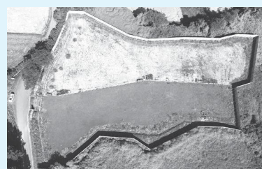
上空から見た小川区仮置場

施工面積は、6,205.73㎡で、使用していた仮設物である仮囲いなどの撤去、地盤の保護層として敷いてある山砂などを除去して、従前の「畑」に原状回復するための工事で、地方自治法などの規定により、議案が提出され可決されました。