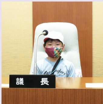
議長席を体験する児童