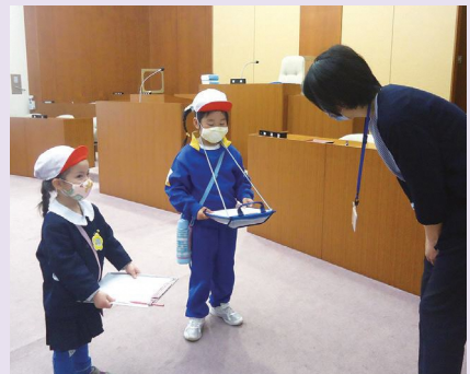
事務局長に質問する園児ら