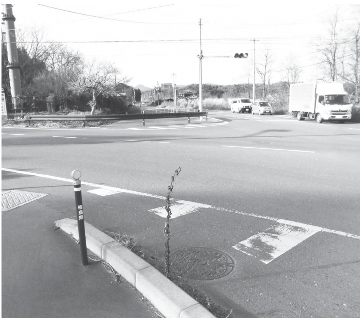
県道下松本・鏡石停車場線と県道郡山矢吹線の交差点

村といたしましては、通行者の安全確保を図るため、今後も、横断歩道の設置を要望して参る考えであります。