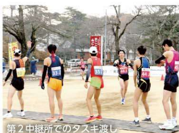
第2中継所でのタスキ渡し