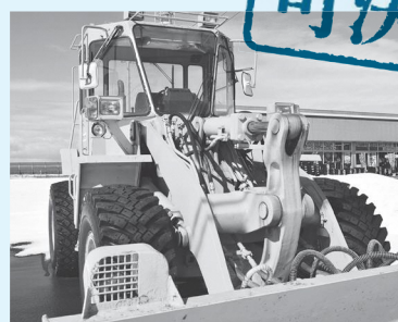
除雪ドーザイメージ

除雪ドーザ2台を取得するにあたり、地方自治法などの規定により、議案が提出され可決されました。今回の購入は、耐用年数が過ぎた除雪車2台の更新で、狭小道路の多い路線でのより効率的で効果的な除雪作業が可能となります。