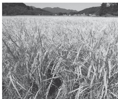
経営が厳しい状況にある米作り

種子購入助成金として補正予算に計上されているが、反当たりにするところ、000円位で非常に少ない。他市町村では8,000円の助成金を出すところがあるので、6,000円くら