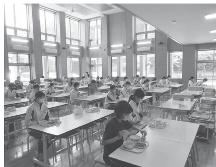
給食の様子（天栄中学校）

村長の答弁では「財政負担を考慮しながら段階的に実施をしていきたい」とのことでした。