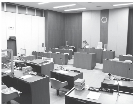
議場は、空気清浄機の設置等、新型コロナウイルス感染症対策をしっかりと行っています。