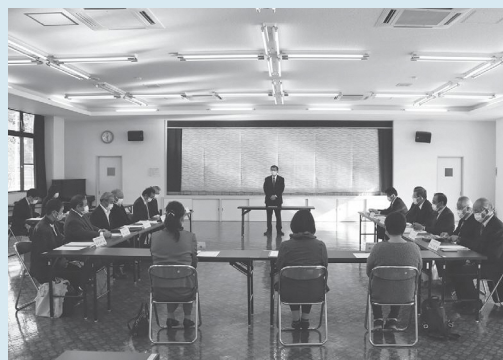
天栄村振興計画審議会の様子

会では、第 5 次総合計画や住民アンケートの結果などについて説明があり、新たな計画策定に向けた意見を交わしました。