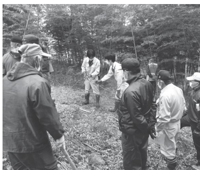
わな免許設置講習の様子

3点目の有害鳥獣捕獲の報償金については、本村では、有害鳥獣捕獲期間は、イノシシ1頭当たり、成獣で3万6,000円、幼獣で2万2,000円、ツキノワグマ、ニホンジカは1頭当たり、それぞれ2万円、ハクビシンは1匹当たり3,000円となっております。須賀川市においては、有害鳥獣捕獲期間で、イノシシとツキノワグマにそれぞれ、1頭当たり2万円、ハクビシン1匹当たり5,000円あります。