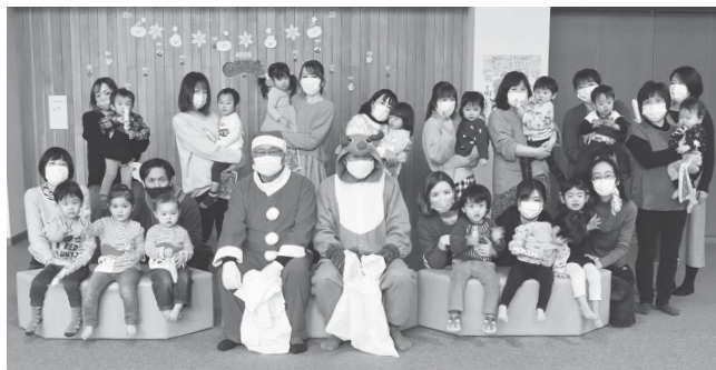
へるすぴあでのクリスマス会の様子

家庭で保育している保護者の交流や相談等の場としての「わんぱく広場」の開設、幼稚園の授業料、入園料、給食費の無料化も実施しております。