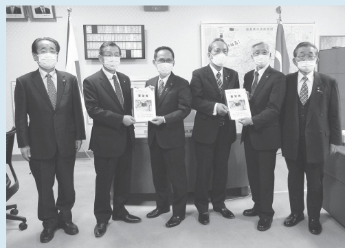
県議会への要望活動の様子

新型コロナウイルス感染拡大防止対策の観点から、市町村長と議会議長のみによる要望活動となりましたが、「鳳坂トンネルの早期完成」や「真名子工区の早期改良整備」など、より一層の支援を要望しました。