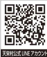
天栄村公式LINEアカウント